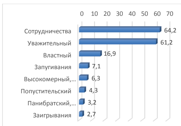
Рис. 3. Распределение ответов студентов на вопрос о преобладающем стиле взаимодействия с преподавателями, уд. вес, в %

Как показал опрос, преобладающим стилем педагогического взаимодействия в аграрных вузах является уважительный (61 %), построенный на сотрудничестве (64 %). Тем не менее, по мнению части опрошенных, имеют место и проявления авторитарности (17 %), запугивания (7 %) и высокомерно-пренебрежительного отношения к студентам (6 %).