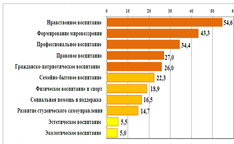
Рис. 2. Распределение ответов педагогов на вопрос, касающийся выбора приоритетных направлений воспитательной работы в вузе, уд. вес, в %

Определенный исследовательский интерес вызывает мнение студентов о критериях воспитанности человека. К этим критериям они прежде всего относят вежливость, предупредительность и тактичность (54 %), уважение достоинства, прав и свобод людей (53 %), толерантность (49 %) и общекультурный уровень (46 %). Однако эти признаки больше касаются внешней, формальной стороны и в меньшей степени затрагивают внутреннюю, содержательную сторону воспитанности человека – личную и гражданскую ответственность (29 %), духовно-нравственную зрелость (20 %), выбор идеала, ценностных ориентиров (19 %) и следование им (6 %). В этой связи встает вопрос поиска приоритетных направлений воспитательной работы в вузе. Отвечая на него (рис. 3), педагоги сошлись во мнении, отдав первые места нравственному воспитанию (61 %) и формированию мировоззрения, системы базовых ценностей (43 %). Далее в ранжире приоритетов следуют профессиональное (34 %), правовое (27 %) и гражданско-патриотическое воспитание (26 %).