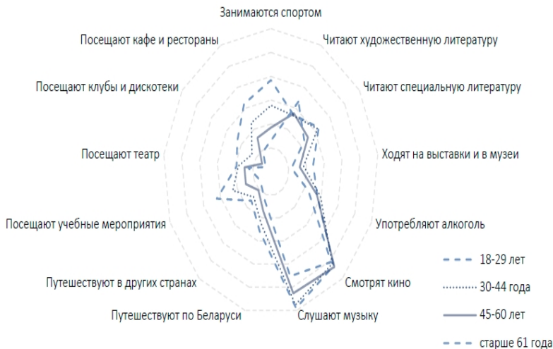
Рис. 1. Дифференциация предпочтений белорусских потребителей в зависимости от возрастной группы [3]

сокой активности или высокая активность и заинтересованность людей помогает им достигать высокого уровня материального благосостояния, остается открытым.