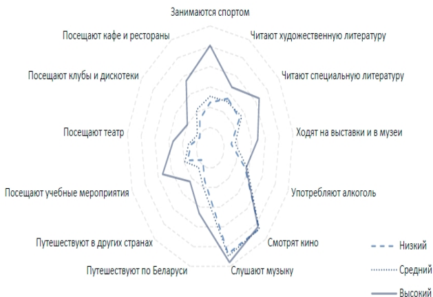
Рис. 2. Дифференциация уровня потребления продуктов культуры в зависимости от уровня доходов белорусских респондентов [3]