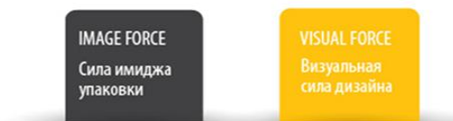
Рис. 1. Методика тестирования упаковки

Материалы и методика исследования. В процессе исследования использовалась модифицированная инновационная специальная методика, разработанная компанией Package Testing Lab (рис. 1).