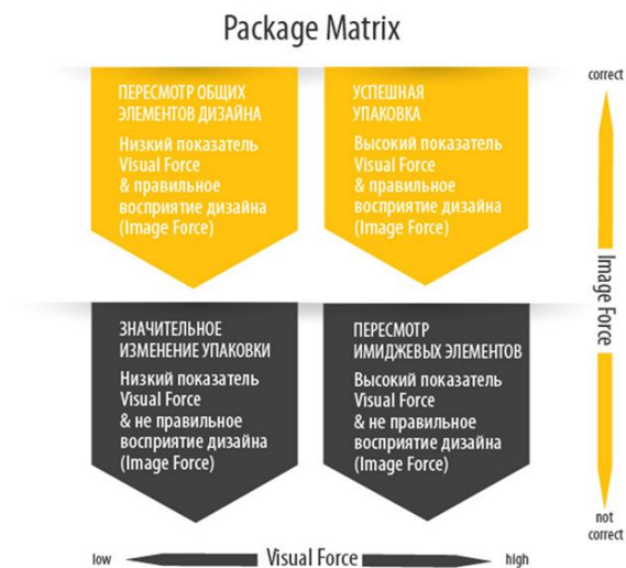
Рис. 2. Сектор тестирования упаковки

Результаты исследования и их обсуждение. На основании полученных результатов оценим эффективность упаковки молока различных производителей, используя Package Matrix, – авторскую разработку компании Package Testing Lab, которая помогает принять управленческое решение о необходимости изменения упаковки, основываясь на метриках ее эффективности (рис. 2).