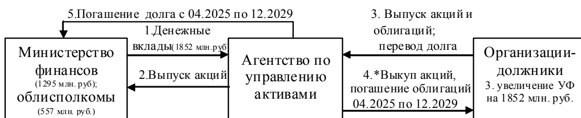
Рисунок 3 – Порядок проведения реструктуризации задолженности организаций АПК Республики Беларусь (в соответствии с указом № 166)

В соответствии с указом № 166 предусмотрен следующий механизм реструктуризации задолженности (рис. 3).