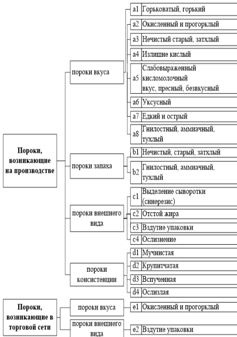
Рис. 4.2. Пороки пищевых продуктов