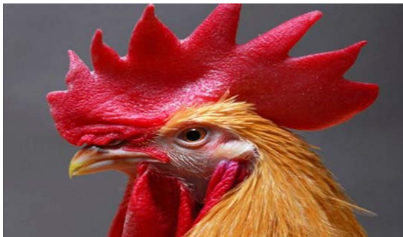
Рис. 9.1. Порода кур леггорн

За последнее время в Республике Беларусь реконструировано более 500 предприятий, построены две новые птицефабрики: в Брестской области – ОАО «Комаровка» и в Могилевской – ОАО «Александрийское». Организация племенных хозяйств, завоз из-за рубежа лучших линий и кроссов, создание новых отечественных позволили практически полностью заменить низкопродуктивную птицу на линейную и гибридную (рис. 9.1).