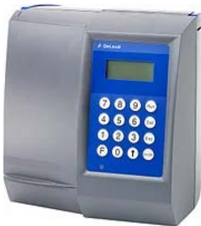
Рис. 3.3. Автоматический анализатор DCC

Таким образом, с помощью автоматических анализаторов можно в течение короткого времени выполнить анализ молока. Определение комплекса показателей в одной пробе позволяет провести оперативную оценку состава и свойств молока-сырья, что дает возможность своевременно управлять процессом производства с целью получения продукта заданного качества.