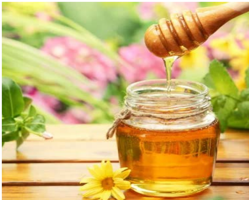
Рис. 9.2. Натуральный пчелиный мед

Вот лишь некоторые полезные свойства меда: