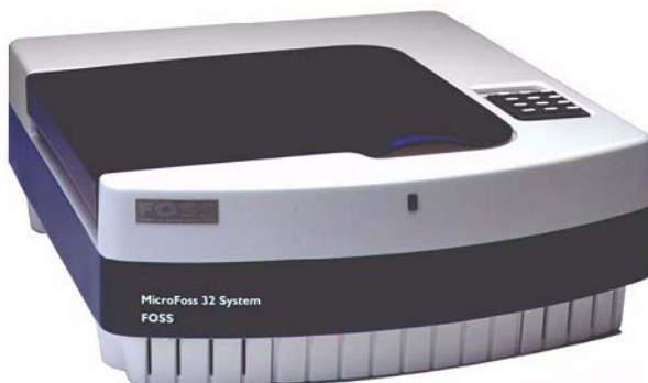
Рис. 3.2. Автоматический анализатор MicroFoss™ 32System

Принцип работы прибора заключается в обнаружении метаболических процессов микроорганизмов с помощью комбинированного применения индикаторных красителей и оптических датчиков. Технология Micro Foss защищена патентом США № 5366873. Данная технология основана на мониторинге изменений химических характеристик жидкой питательной среды, в которой выращивается целевой микроорганизм. Система контролирует изменения цвета в результате микробиологической активности. На дне тест-виалы TVC Medium находится агаровая пробка, через которую выполняются оптические измерения. Образец молока помещается в питательную среду. Излучение светоизлучающих диодов проходит через агар, и фотодиод реагирует на изменение цвета, вызванное размножением микроорганизмов. Как только обнаружено изменение цвета, автоматически регистрируется факт и время обнаружения. Время обнаружения обратно пропорционально количеству бактерий в образце. Результаты выдаются в течение 2–12 ч в зависимости от количества микроорганизмов в исследуемых пробах молока.