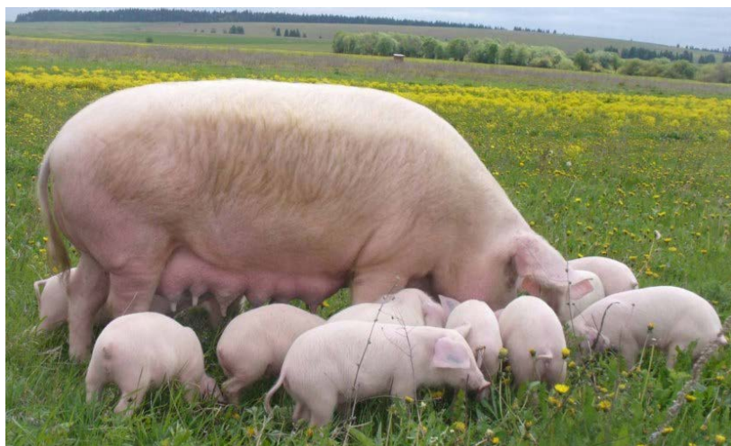
Рис. 8.1. Крупная белая порода свиней

Производство свинины сегодня – это производство, независимое от земельных ресурсов и работающее в основном на закупных кормах. Поэтому основная часть расходов (корма) очень существенно зависит от мировых цен на зерно, сою и другие компоненты.