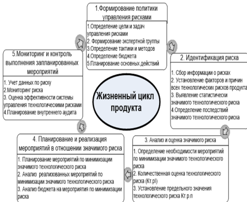
Рис. 4.1. Этапы формирования политики управления технологическими рисками

Возникновение пороков обуславливается качеством сырья, несоблюдением режимов технологического процесса, санитарно-гигиенических условий производства, транспортирования и условий хранения и др. [23].