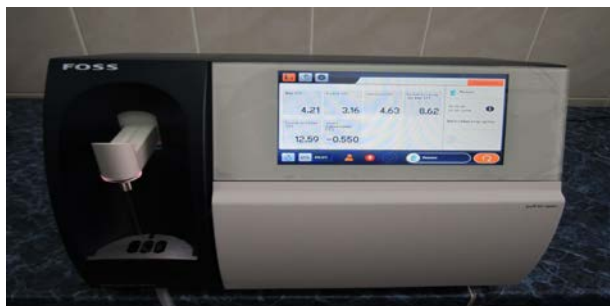
Рис. 3.1. Автоматический анализатор MilkoScan™ Mars

Принцип работы прибора заключается в использовании технологии инфракрасной спектроскопии с преобразованием Фурье.