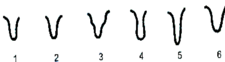
Рис. 2. Формы сосков вымени коров:

При толстых сосках конической формы доильные стаканы присасываются лишь к их кончику, что оказывает отрицательное влияние на интенсивность доения, полноту молокоотдачи и состояния здоровья вымени. Воронкообразные соски сдавливаются краями присоска резины в месте перехода к основанию вымени, в результате чего происходит сужение соскового канала. Соски должны быть цилиндрической или незначительно конической формы (рис. 2), длиной от 5 до 9 см и диаметром в средней части после доения от 2,0 до 3,2 см. Передние соски на 1–1,5 см длиннее задних [7].