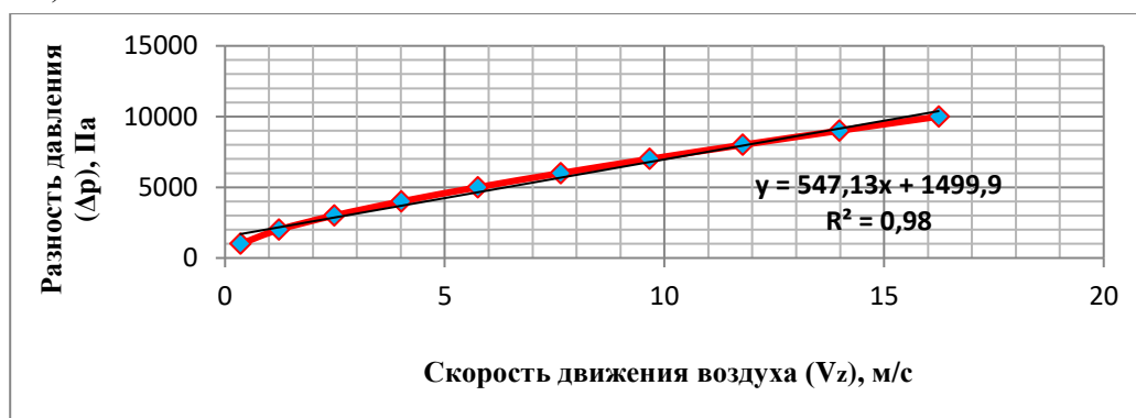
Рис. 4. Графическая зависимость разности давления в доильном стакане от скорости движения воздуха между сосковой резиной и соском вымени коровы

После определения скорости движения воздуха ( V_z ), построим график зависимости разности давления в доильном стакане от скорости движения воздуха между сосковой резиной и соском вымени коровы (рис. 4).