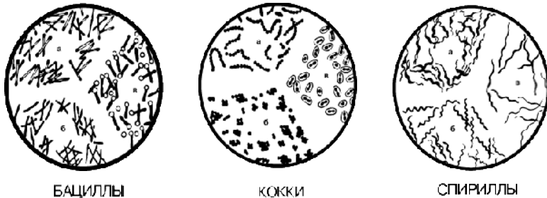
Рис. 1. Формы микроорганизмов

1. Морфологические – форма (рис. 1), величина, особенности взаиморасположения, структура.