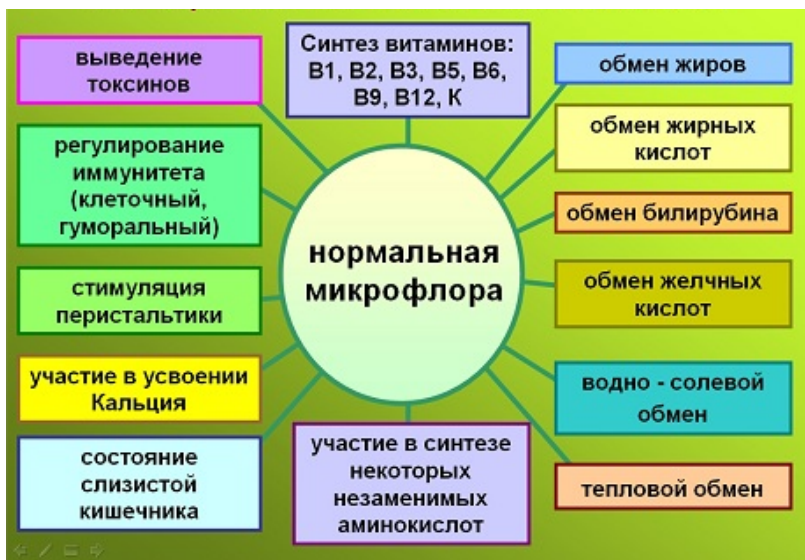
Рис. 4. Функции нормальной микрофлоры

Роль нормальной микрофлоры. Нормальная микрофлора играет важную роль в защите организма от патогенных микробов, например, стимулируя иммунную систему, принимая участие в реакциях метаболизма. В то же время эта флора способна привести к развитию инфекционных заболеваний (рис. 4).