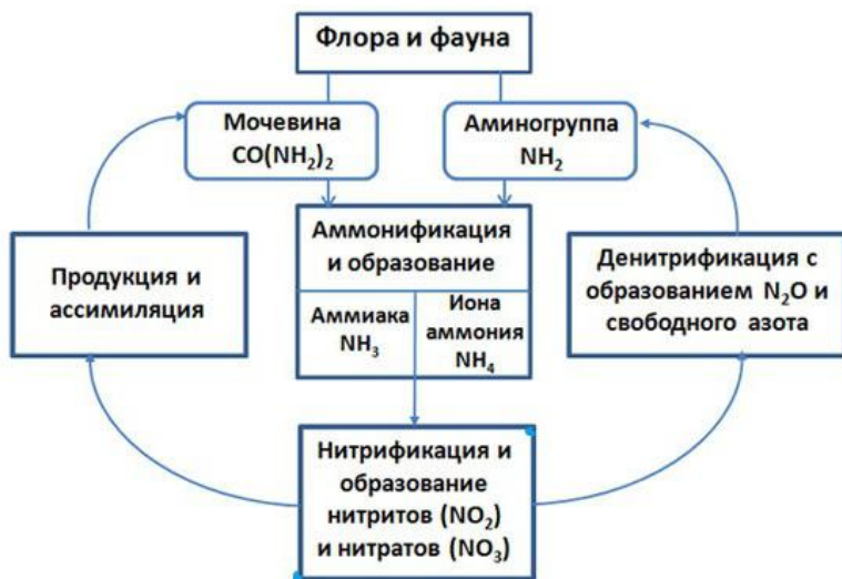
Рис. 5. Круговорот азота

Роль биологических факторов в балансе азота огромна: биологическая фиксация атмосферного азота составляет 54 млн. тонн в год, при общем поступлении его, включая индустриальную фиксацию, 91,8 млн. тонн в год. Удаление азота из почв и водоемов, обусловленное процессами денитрификации, – это микробиологический процесс, в который ежегодно вовлекается около 83 млн. тонн азота. В общих чертах этот круговорот состоит из таких этапов, как азотфиксация, аммонификация, нитрификация, денитрификация (рис. 5).