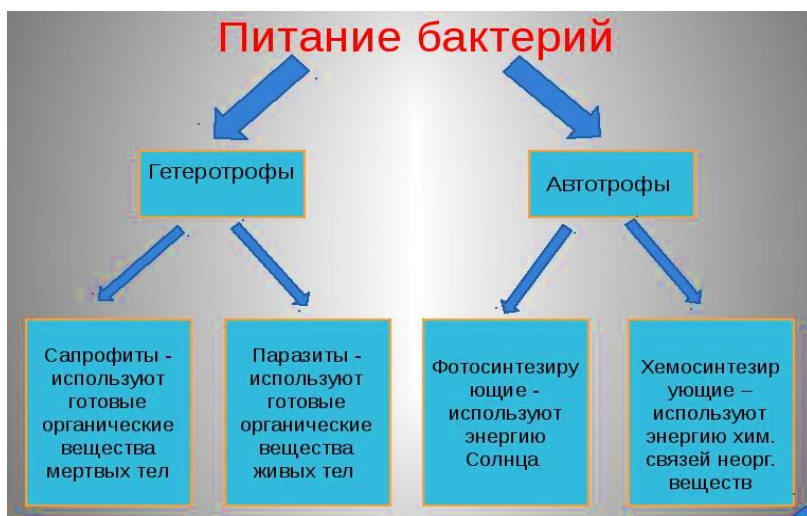
Рис. 2. Формы питания бактерий

По источнику углеродного питания микроорганизмы разделяются на две группы: автотрофные и гетеротрофные (рис. 2).