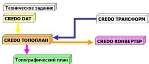
Рис. 1. Схема построение цифровых топографических планов с использованием программного комплекса CREDO

В общем всю технологию построения цифровых топографических планов с использованием программного комплекса CREDO можно представить следующей схемой (рис. 1).