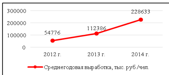
Рис. 1. Динамика изменения среднегодовой выработки специалиста по оценке недвижимости

Динамика изменения среднегодовой выработки оценщика недвижимости представлена на рис. 1.