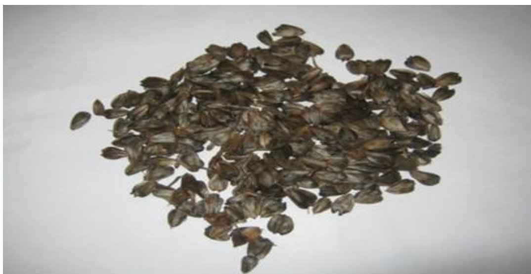
Рис. 3. Семена сильфии пронзеннолистной

2019 год был неблагоприятным для получения семян растений. Июль месяц активного цветения был холодный и дождливый. За весь месяц выпало практически в 2 раза больше нормы осадков (135,2 мм). Август также был прохладным, ниже климатической нормы, но с меньшим количеством дождей. Из-за холодного периода и обильных осадков созревание корзинок было неравномерным и затяжным. К уборке семян приступили лишь к 21 сентября (рис. 3).