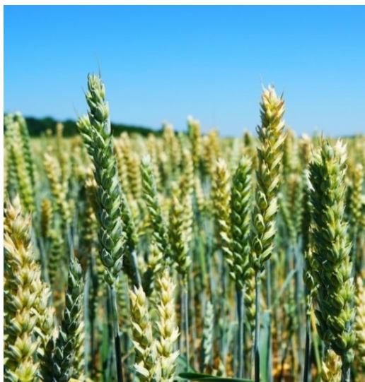
Рис. 5. Яровая пшеница

Отходы пшеничного мукомольного производства используют в качестве концентрированного корма для сельскохозяйственных животных.