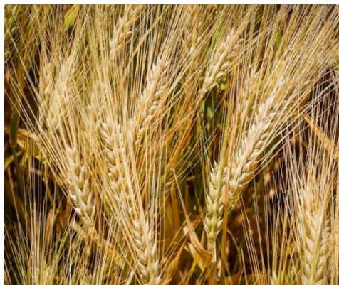
Рис. 4. Озимый ячмень

Озимый ячмень (рис. 4) в условиях Беларуси может возделываться как продовольственная, зернофуражная и техническая культура.