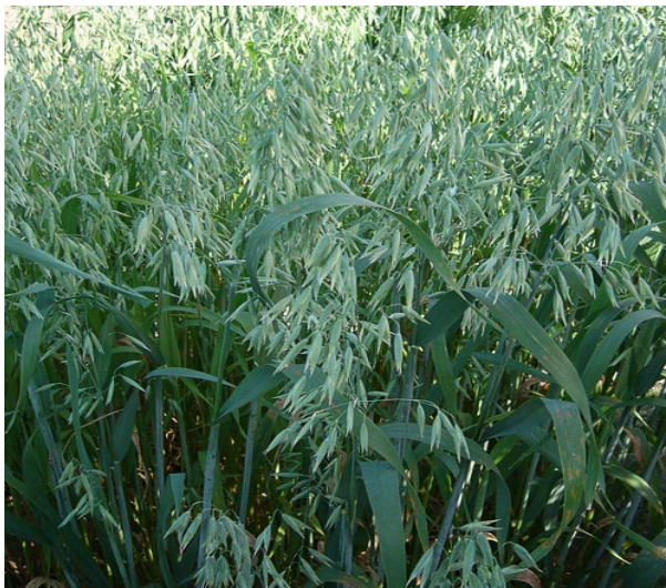
Рис. 7. Овес

Широко используется овес в питании (крупа, хлопья, толокно), а также в кондитерской промышленности и производстве детского питания. Овес имеет огромное агротехническое значение как хороший предшественник для большинства сельскохозяйственных культур и как первая культура при освоении новых и рекультивируемых земель. Корневая система овса способна усваивать труднорастворимые фосфаты благодаря выделению угольной и других кислот. Преимуществом овса перед другими зерновыми является его невысокая требовательность к уровню агротехники. Он практически не поражается корневыми гнилями. Это единственная из зерновых теневыносливая культура, у которой не наблюдается существенного снижения массы зерен при полегании и затенении бобовыми (горох, вика) в смешанных и совместных посевах.