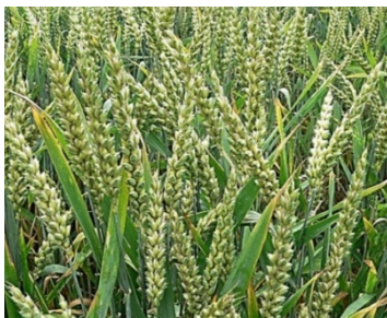
Рис. 1. Озимая пшеница

Пшеничные отруби – высококонцентрированный корм для всех видов сельскохозяйственных животных. Солома и мякина имеют большую кормовую ценность. Солому в измельченном и запаренном виде или обработанную химическими веществами охотно поедают овцы и крупный рогатый скот. В 100 кг соломы содержится 0,5–1,0 кг переваримого протеина, 20–22 к. ед. Солома используется как строительный материал для изготовления бумаги, подстилки животным и т. д.