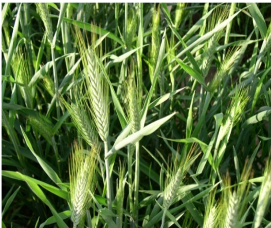
Рис. 8. Яровая тритикале

Высокая кормовая ценность зерна тритикале обеспечивается среди всех зерновых культур самый высокий показатель эффективности использования корма. Установлено, что замена 40 % зерна в обычных комбикормах зерном тритикале увеличивает привесы свиней на откорме на 18–30 % и экономит 15–20 % корма. Поэтому зерно яровой тритикале в основном используется в качестве хорошего компонента для приготовления комбикормов.