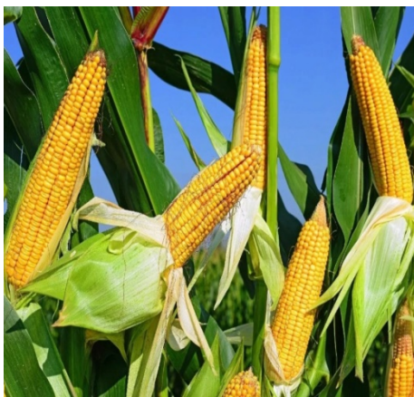
Рис. 9. Кукуруза

Кукуруза (рис. 9) – культура высокой продуктивности и всестороннего применения. В мире она возделывается главным образом на фуражные цели.