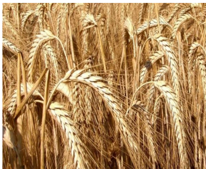
Рис. 3. Озимая тритикале

Озимая тритикале (рис. 3) – ценная зерно-кормовая культура. Зерно тритикале может использоваться в хлебопекарной, кондитерской, пивоваренной, спиртоводочной и комбикормовой промышленности. Считается, что лучший по качеству хлеб получается из смеси муки пшеничной (70–80 %) и тритикалевой (20–30 %). Тритикале широко используется на кормовые цели. По химическому составу зеленый корм из тритикале близок к пшенице, но в нем содержится больше сырого протеина (15,1–18,2 %) и лизина (0,5 %).