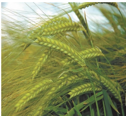
Рис. 6. Яровой ячмень

Яровой ячмень (рис. 6) – важная продовольственная, кормовая и техническая культура.