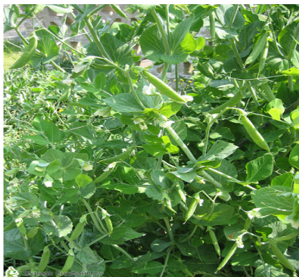
Рис. 10. Горох посевной

ляются на 7–8-й день. Всходы и молодые растения гороха могут переносить кратковременные заморозки до -4...-5 °С.