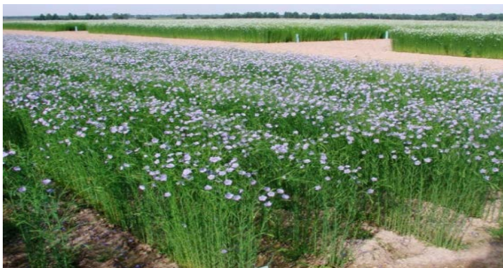
Рис. 16. Лен-долгунец

Лен-долгунец (рис. 16) возделывают для получения двух видов продукции – волокна и семян.