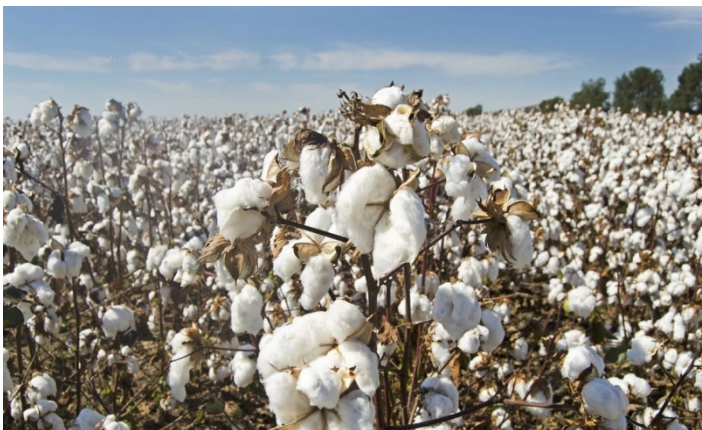
Рис. 15. Хлопчатник

В мировом потреблении прядильных материалов хлопковое волокно занимает первое место. Оно является основным сырьем для текстильной промышленности, а также используется в автомобильной, целлюлозной и других отраслях промышленности.