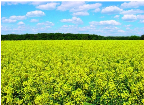
Рис. 17. Рапс

Ранс (рис. 17) является основной масличной культурой Беларуси. В семенах рапса содержится 40–46 % жира, 22–27 % протеина в пересчете на сухое вещество.