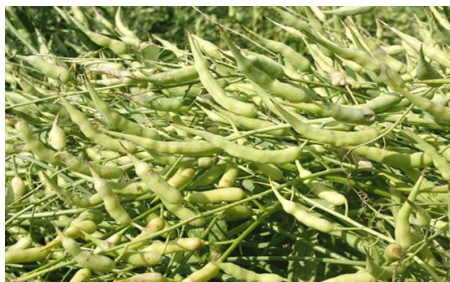
Рис. 18. Редька масличная

Редьку масличную (рис. 18) выращивают для получения масла, на зеленый корм и в качестве сидеральной культуры.