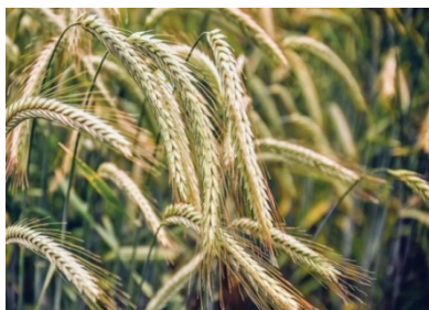
Рис. 2. Озимая рожь

Озимая рожь (рис. 2). Содержание белка в зерне ржи колеблется от 9 до 16 % в зависимости от условий выращивания и сорта. Кроме того, в зерне содержатся витамины А, В 1 , В 2 , В 6 , РР (никотиновая кислота) и Е. В состав зерна ржи входят ненасыщенные жирные кислоты, способные растворять холестерин в организме человека. По мукомольно-хлебопекарным качествам оно уступает только зерну пшеницы. Ржаной хлеб по усвояемости хуже пшеничного, но по калорийности и вкусовым достоинствам не уступает ему.