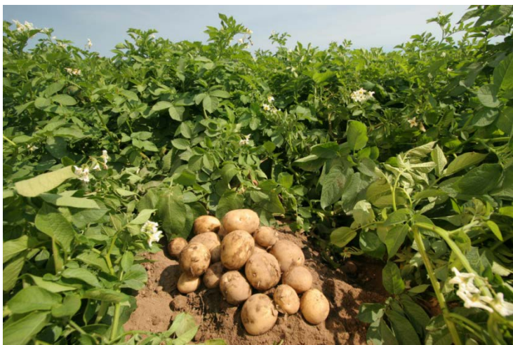
Рис. 13. Картофель

При благоприятных погодных условиях, на плодородных почвах, при своевременном и правильном выполнении всех агротехнических приемов современные сорта картофеля способны формировать урожай в 500–700 ц/га. Но урожай клубней 250 ц/га равен урожаю 75 ц/га зерновых культур. Картофель, как ни одна культура, отличается универсальностью использования и применяется на продовольственные, технические и кормовые цели.