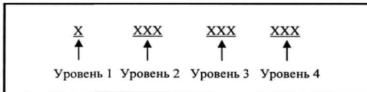
Рис. 5.1. Структура кода СОАТО

код г. Бреста, 368 – код Московского района г. Бреста); для д. Знаменка Брестского района Брестской области – 1212808031 (где 1 – код Брестской области, 212 – код Брестского района, 808 – код Знаменского сельского Совета, 031 – код д. Знаменка).