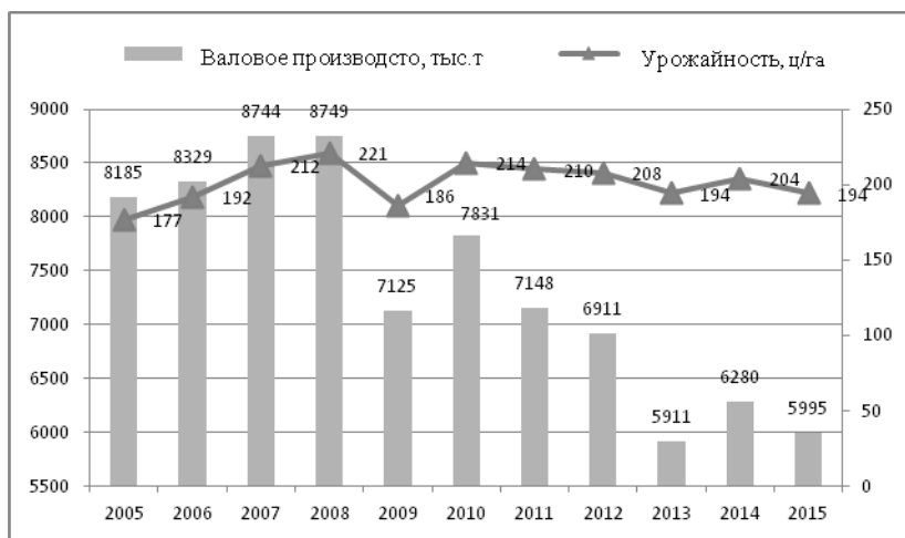
Рис. 1. Валовое производство и урожайность картофеля (2005–2015 гг.)

Таким образом, картофелеводческая отрасль республики потеряла значимые позиции на внешнем рынке и сократила объемы производства, при этом заметен значительный рост урожайности в период с 2005 по 2015 гг., составив при этом в динамике 15,25 % (рис. 1).