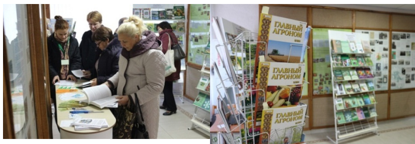
Оформление мобильного пункта библиотечного обслуживания БелСХБ

Если организация, которая проводит научное мероприятие, состоит с БелСХБ в договоре на информационное обслуживание, то в поиск добавляются индивидуальные тематические запросы специалистов данной организации. Обязательно проводится оповещение читателей о предстоящей выставке (проводится e-mail-рассылка и выставляется информация на сайт). Затем начинается подготовка промоматериалов к выставке: создаются буклеты, где указана экспонируемая литература (обязательно в буклет помещается познавательная информация, чтобы заинтересовать потенциальных пользователей). К каждой выставке выпускается небольшой бюллетень, в котором размещаются различные актуальные материалы о научной жизни (поясняющие статьи по наукометрии и др.). Создается небольшая мультимедийная презентация, которая рассказывает о библиотеке и тех услугах, которые могут пригодиться участникам конференции.