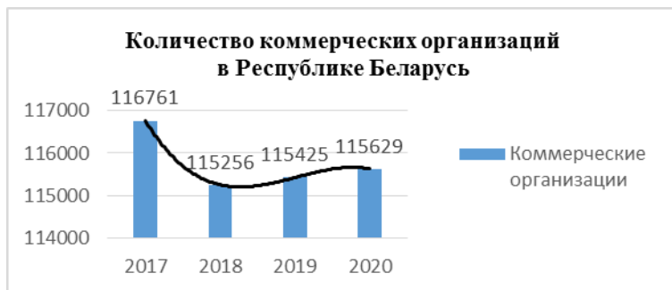
Рис. 1. Коммерческие организации в Республике Беларусь в 2017–2020 гг.

Согласно данным Национального статистического комитета Республики Беларусь, после довольно резкого снижения показателя числа коммерческих организаций в стране в период с 2018 г. по 2020 г. в Беларуси был отмечен незначительный рост данного показателя (рис. 1).