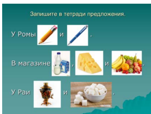
Рис. 2. Упражнение на отработку звука [P]

3 слайд – упражнение «найти слова с буквой Р» (рис. 3).