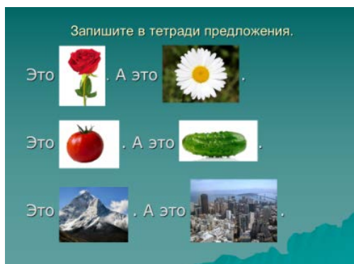
Рис. 1. Упражнение на отработку звука [P]