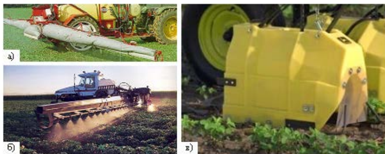
Рис. 2. Системы, снижающие снос рабочих растворов при опрыскивании: а – система принудительного воздушного осаждения капель; б – электростатическая система распыливания; в – ветрозащитные устройства

Один из путей снижающий снос – не проводить опрыскивание при температуре выше 25 °С и влажности ниже 30 %, а также избегать образования мелких капель (150 микрон и меньше), используя специальные распылители, работа которых основана на принципе Ventury . При использовании данных распылителей в процессе образования капель в них добавляются пузырьки воздуха, что приводит к увеличению их размеров. При использовании данного типа распылителей наличие мелких капель (менее 80 мкм) в факеле распыла практически не бывает. Если исключить такие капли невозможно, то необходимо использовать опрыскиватели с системой принудительного воздушного осаждения капель (рис. 2, а), с электростатической системой распыливания (рис. 2, б) либо с использованием ветрозащитных устройств (рис. 2, в).