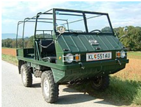
Steyr-Puch Haflinger, österreichischer Exportschlager

Vielzahl von Tochterfirmen in Österreich auf, was die Arbeitslosenquote wie in Deutschland auf unter 3 Prozent drückte. Milliardenprojekte, wie der Aufbau des Speicherkraftwerkes Kaprun oder der Ausbau der Westautobahn (Salzburg-Wien) wurden in Angriff genommen und schufen wiederum Arbeitsplätze.