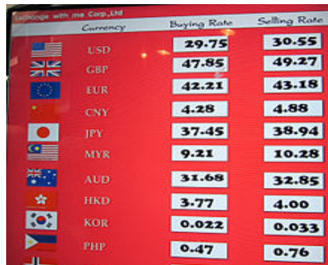
Wechselkurse einer asiatischen Wechselstube

Um im Ausland einkaufen zu können, muss man i. d. R. das inländische Zahlungsmittel gegen das ausländische Zahlungsmittel tauschen. Auch wenn z. B. ein deutscher Exporteur Waren im Ausland verkauft hat und dafür Geld in ausländischer Währung erhielt, wird er es i. d. R. in inländische Währung umtauschen. Der Umtausch erfolgt zum jeweils gültigen Wechselkurs. Der Wechselkurs ist das Austauschverhältnis zweier Währungen.