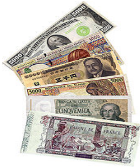
Banknoten aus verschiedenen Ländern

Als Wahrung oder Wahrungseinheit wird auch die vom Staat anerkannte Geldart (das gesetzliche Zahlungsmittel eines Landes) bezeichnet. In diesem Fall ist Wahrung eine Unterform des Geldes. Die meisten Wahrungen werden an den internationalen Devisenmarkten gehandelt. Der sich dort ergebende Preis wird als Wechselkurs bezeichnet.