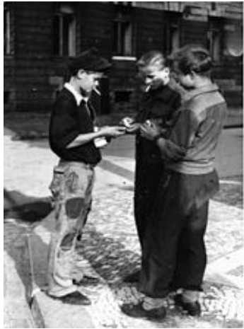
Jugendliche handeln mit Zigaretten auf dem Schwarzmarkt, Westdeutschland 1948

Derzeit gibt es weltweit über 160 offizielle Währungen, aber nur der US-Dollar und in zunehmendem Maße auch der Euro gelten als internationale Leitwährungen. Daneben gibt es noch Komplementärwährungen, die nur regional neben dem offiziellen Geld als Tauschmittel akzeptiert werden.