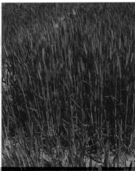
Коллекционный питомник озимой мягкой пшеницы

По результатам селекционной оценки ежегодно вовлекается в селекционный процесс более 200 образцов. Из полученных гибридных популяций F_2 – F_4 выделены ценные генотипы, созданы новые сортообразцы и сорта.