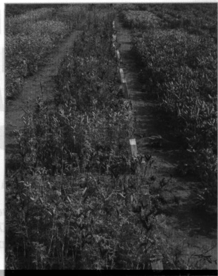
Оценка образцов люпина на инфекционном фоне

ставляющие интерес в качестве селекционного материала.