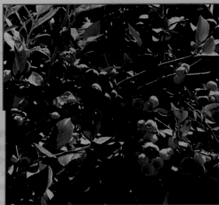
Плодоношение голубики высокорослой

В коллекционных питомниках и ботаническом саду БГСХА студенты, магистранты и аспиранты знакомятся с последними достижениями селекции, изучают методики, проводят научные исследования, необходимые для написания научных работ.