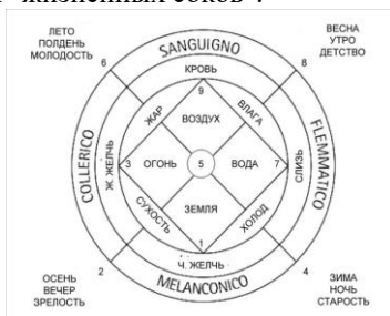
Рисунок 1. Планировка лекарственного сада Минервы

Высокой оценки заслуживает планировка сада Минервы в городе Салерно в Южной Италии, колыбели Салернской медицинской школы, известной с IX века (рис. 1). Этот сад с богатым источником, принадлежавший в XIV веке врачу Салернской школы Маттео Силватико, мы с удовольствием посетили в феврале 2017 г. Планировка сада Минервы была характерна для многих средневековых садов Европы. В основе сада лежало деление растений по их свойствам, «темпераментам». Древнегреческий врач Гиппократ объяснял темперамент (лат. temperamentum – «надлежащее соотношение частей»), как особенности поведения, преобладанием в организме одного из четырех "жизненных соков".