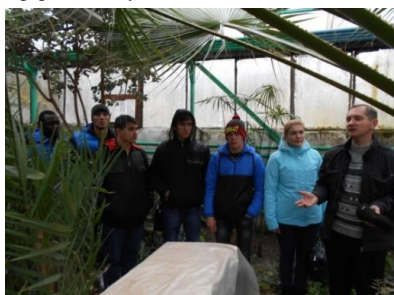
Экскурсия в оранжерею ботанического сада РГУ

Таким образом, дендрологический парк и ботанический сад являются важными элементами в системе экологического образова-