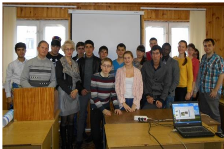
Научно-практическая конференция студентов