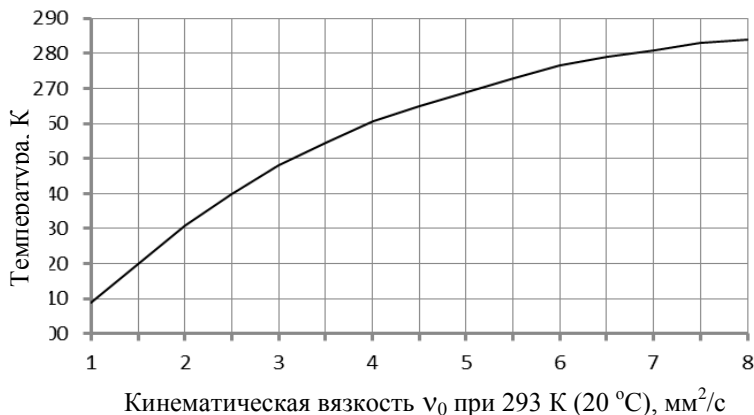
Рис. 2. Зависимость минимальной температуры прокачивания дизельного топлива по системе питания от его кинематической вязкости \nu_0 при 293 К (20 °С)

сывании ТПН не превышало 12 кПа. Исследования проводились на трех образцах дизельных топливах марки ДТ-Л-К5 с кинематической вязкостью при 293 К соответственно 4,5 мм 2 /с; 5 мм 2 /с и 6 мм 2 /с. В результате эксперимента было определено, что для топлива с кинематической вязкостью при 293 К (+20 °С) равной 4,5 мм 2 /с разрежение перед ТПН начинает превышать минимально-допустимое при температуре топлива –8 °С (265 К), для топлива с вязкостью 5 мм 2 /с – при –5 °С (268 К), и для топлива с вязкостью 6 мм 2 /с – при +1 °С (274 К).