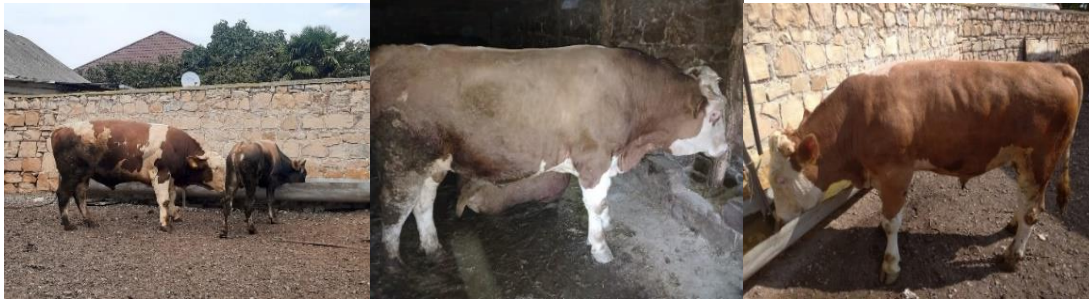
9. 18 , > 2