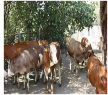
5. F2 F3