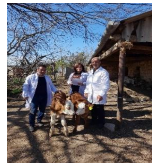
8. F3 >3