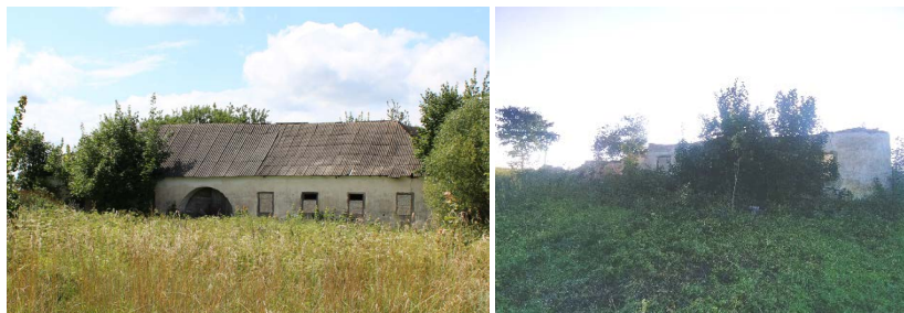
Мал. 2 і 3. Гаспадарчае збудаванне ў 2020 г. і 2023 г.

яшчэ ў адной сядзібе ў Шчорсах (Навагрудскі раён Гродзенскай вобласці). Уваход ва ўнутраны двор праз паўцыркульныя аркі праезда знаходзіцца на паўднёва-ўсходнім корпусе. Характар архітэктуры сведчыць, што паўднёва-ўсходні корпус выкарыстоўваўся для жылля (жылыя памяшканні з прамавугольнымі праёмамі і драўлянай перамычкай знаходзяцца па правы і левы бакі ад аркі праезду ўнутры), іншыя карпусы – для размяшчэння коняў і вазоўні. Унутры двара размешчаны тры ўваходы ў гаспадарчыя памяшканні. Сцены выкладзены з буту ў тэхніцы рызынкавай муроўкі, абрамленне аконных і дзвярных праёмаў, а таксама гзымс, пілястры і куты выкананыя з цэгля і атынкаваныя. Найцікавейшай асаблівасцю з’яўляецца наяўнасць ва ўнутраным двары на сцяне паўднёва-ўсходняга фасада надпісу “Rok 1851” (Анатоль Федарук лічыць, што “1861” [5, 502]).