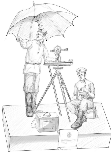
Рис. 1. Скульптурная композиция «Землеустроители»