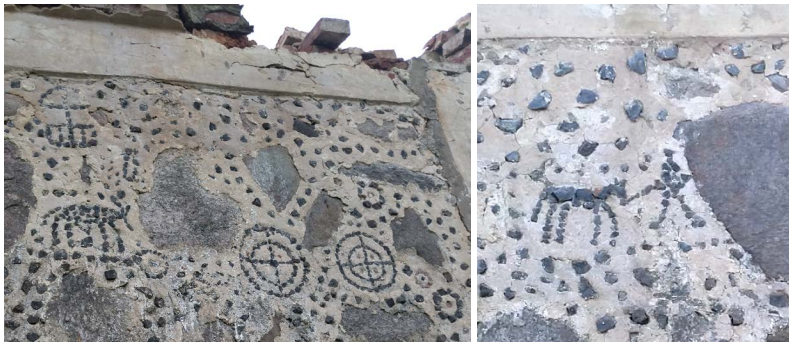
Мал. 4 і 5. Фрагмент паўночна-ўсходняга фасада з пектрогліфамі

збудаванне – рэдкі прыклад. Гэтыя піктаграмы з’яўляюцца ўнікальнай культурнай і гістарычнай з’явай у беларускім дойлідстве, а таму патрабуюць захавання і далейшага вывучэння.