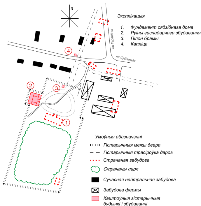
Мал. 1. Гісторыка-архітэктурны апорны план