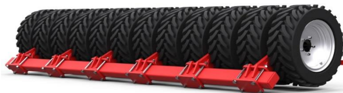
Рис. 11. Шинный каток

В последние годы на некоторых агрегатах для предпосевной подготовки почвы и почвообрабатывающе-посевных агрегатах начали применять катки в виде полых резиновых шин (рис. 11) [4, 10, 11].