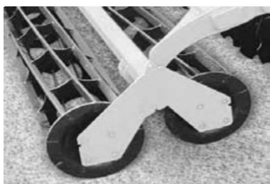
а) планчатый каток

Прутковые, планчатые и трубчатые катки состоят из дисков и приваренных к ним прутков круглого сечения (прутковые катки), труб (трубчатые катки) или планок (планчатые катки). Поскольку в настоящее время в комбинированных агрегатах прутковые катки практически не применяются, то рассмотрим только планчатые и трубчатые катки (рис. 8).