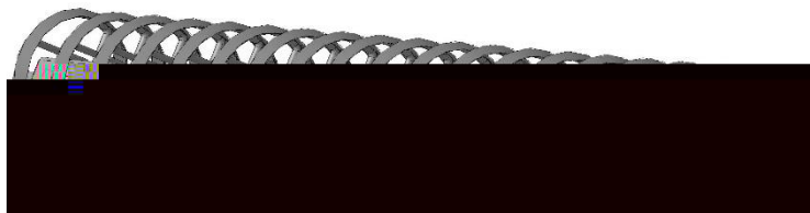
Рис. 9. Спиральный каток

Спиральные катки (рис. 9) по сравнению со всеми известными типами катков обладают лучшими характеристиками по выравниванию поверхности почвы, но низкой технологичной надежности при повышенной влажности и недостаточным уплотнением и крошением почвы.