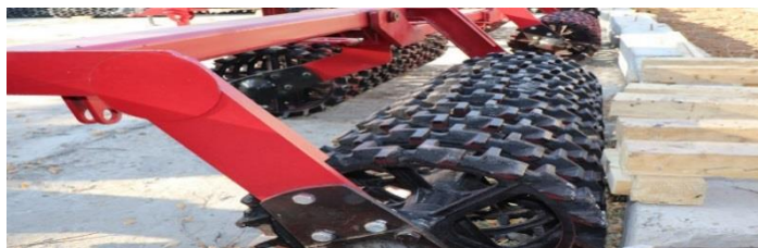
Рис. 7. Кольчато-шпоровый каток

Следующим типом катков являются кольчато-шпоровые катки, которые отличаются от кольчатых катков, кольца которых установлены на валу тем, что для повышения крошащей способности их кольца имеют на боковой поверхности выступы в виде шпор (рис. 7).