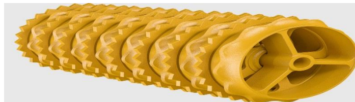
Рис. 6. Кольчато-зубчатый каток фирмы «Vaderstad» (Швеция)

Повысить качество крошения и уменьшить налипание влажной почвы позволяют кольчато-зубчатые катки (рис. 6) [3, 7, 8, 9].