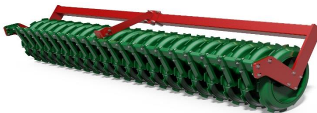
Рис. 3. Кольчатый каток с зубчатой наружной поверхностью колец

Для улучшения качества крошения, наружные кромки кольца могут изготавливаться различной конфигурации (рис. 3) в виде: зубьев; звездочек; других выступов и вырезов.