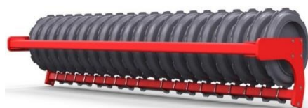
а) с металлическими кольцами

Еще больше повысить несущую способность позволяют кольчатые катки, кольца которых установлены на барабане (рис. 5). При этом кольца могут изготавливаться как металлическими, так и резиновыми [2–6].