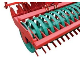
в) в виде конуса