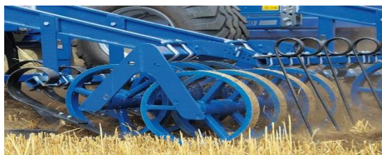
Рис. 2. Кольчатый каток с U-образным профилем кольца

В результате этого исключается налипание почвы на кольца, обеспечивается хорошее сцепление колец с почвой, а следовательно, исключается и пробуксовка катка. Вместе с тем, данный тип катков имеет низкую несущую способность, качество крошения и большую вероятность забивания пространства между кольцами при обработке переувлажненной почвы. Поэтому для улучшения этих показателей кольчатые катки, как правило, устанавливаются в два ряда.