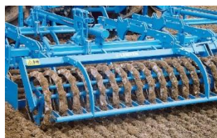
б) в виде трапеции