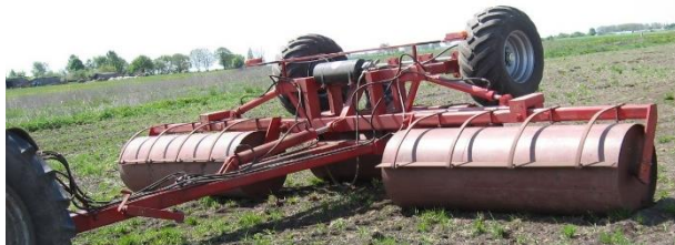
Рис. 1. Гладкий каток

Гладкие катки (рис. 1) в основном изготавливаются в виде пустотелого цилиндра, заполненного водой. Изменяя количество воды в цилиндре, меняется удельное давление катка на почву. Недостатком его является то, что он уплотняет как подповерхностный, так и поверхностный слой почвы, что ускоряет процесс испарения влаги. Кроме того, такие катки не могут производить рыхление почвы, а следовательно, создавать мульчирующий слой.