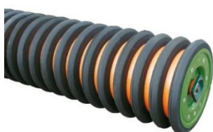
а) в виде клина

Повысить несущую способность и улучшить качество работы кольчатых катков можно путем применения колец с поперечным сечением в виде клина, трапеции, конуса и др. (рис. 4).