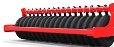
б) с резиновыми кольцами