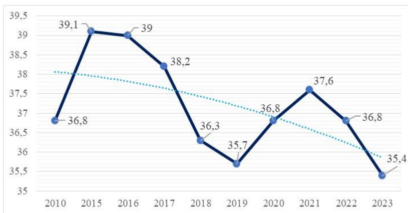
Рис. 1. Доля потребительских расходов на продукты питания, в процентах к итогу

Согласно статистическим данным потребительские расходы домашних хозяйств на продукты питания занимали достаточно существенную долю (35,4 %) (рис. 1).