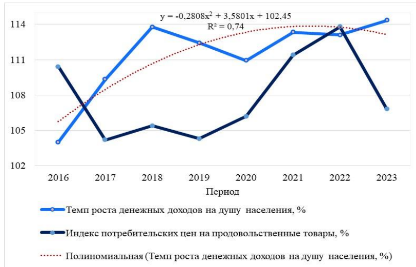
Рис. 4. Динамика показателей по Республике Беларусь, %

Так, средний коэффициент опережения денежных доходов населения над индексом потребительских цен на продовольственные товары составляет 1,03, что говорит о положительной динамике. Наглядное представление происходящих изменений представлено на рис. 4.