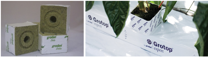
Рис. 1. Минеральная вата

Все минераловатные плиты стандартной плотности пригодны для использования. Два основных преимущества минеральной ваты – ее стерильность и способность обеспечивать оптимальное соотношение воздуха и воды в корневой зоне при соответствующем регулировании интенсивности полива. Культура и субстрат всегда должны быть полностью изолированы от пола теплицы. Основной особенностью минеральной ваты является то, что она позволяет регулировать водно-