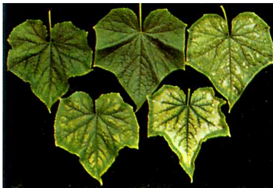
Рис. 4. Признак недостатка магния в листьях огурца

Магний. Недостаток хлорофилла проявляется в посветлении листьев, окраска листьев изменяется с зеленой на желтую, красную, фиолетовую. Между зелеными жилками листа проявляется хлороз (рис. 4). У томатов на листьях между жилками появляются коричневые пятна, лист вянет, засыхает и опадает. Опадают плодоножки. Плоды мелкие, созревание преждевременное. У огурца на старых листьях проявляется хлороз. Желтеют с краев пластинки листа. Жилки и пластинка вокруг полосой около 5 см еще сохраняет нормальный зеленоватый цвет.