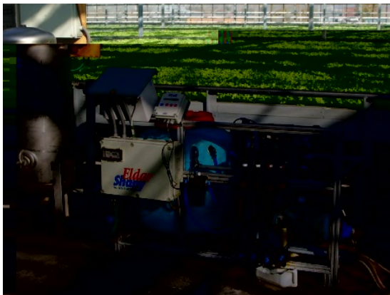
Рис. 2. Оборудование для смешивания растворов

Рабочий раствор рекомендуется получать разведением маточного раствора водой в соотношении 1:100, допустимо 1:50 или 1:200. Растворы А и Б подают одновременно и разбавляют водой до заданной электропроводности рабочего раствора (ЕС).