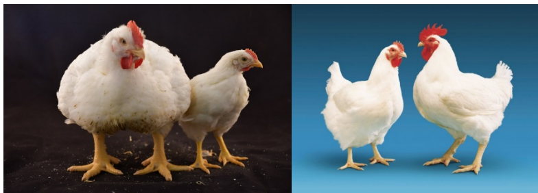
Рис. 1. Кросс «Росс-308»

Это сильный, быстрорастущий бройлер, имеющий высокие мясные показатели. Перья такой птицы всегда белого цвета. Другие разновидности окраса не допускаются и свидетельствуют о необходимости выбраковки. Маленькая голова с крупным красным гребнем в форме листа и округлыми серёжками; очень короткая шея; овальный массивный корпус; сильно выступающая грудь; широкая спина; хорошо обмускуленные бёдра и голени; крепкие жёлтые плюсны широко расставлены (рис. 1).