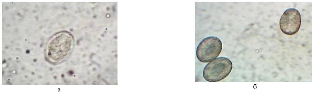
Рис. 1. Пыльцевые зерна Brassica napus под микроскопом (увеличение в 600 раз): а – в образце меда, б – пыльца растения

Для изучения ботанического состава в течение всего медосбора отбирались образцы меда. На экспериментальном участке, расположенном в черте города Бреста, благодаря обилию древесных, кустарниковых и травянистых медоносов, был получен полифлерный мед, отличающийся обилием пыльцы различных видов растений. В образцах, собранных в конце июня, отмечено присутствие следующих видов: акация белая ( Robinia pseudoacacia ), боярышник обыкновенный ( Crataegus laevigata ), черемуха обыкновенная ( Prunus padus ), калина обыкновенная ( Viburnum opulus ), клевер луговой ( Trifolium pratense ), одуванчик лекарственный ( Taraxacum officinale ). Мед, собранный в начале июня, показал присутствие пыльцевых зерен рапса Brassica napus (около 40 %) (рис. 1).