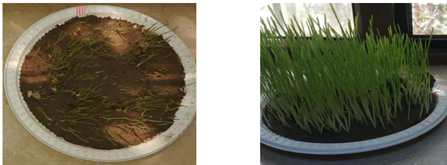
Рис. 4. Результаты опытов на лугово-серозёмном типе почвы с добавлением измельченной шелухи Tamarix, обработанной в электрическом импульсном разряде и посаженной пшеницей сорта Безостая-1, активированной в электрическом импульсном газовом разряде ( U=10 kv, t=6 min), полученные до и на 25 -й день эксперимента

активированную в электрическом импульсном газовом разряде. Напряжение импульсного газового разряда U=10 kv, время обработки t=6 min, (фото 4, табл. 2).