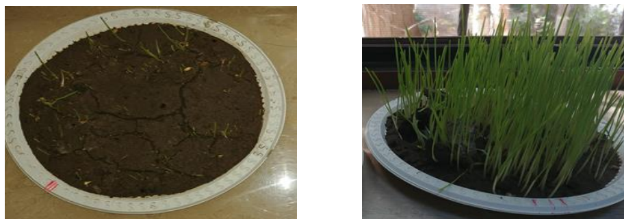
Рис. 3. Результаты опытов на лугово-серозёмном типе почвы с добавлением измельченной шелухи Tamarix, обработанной в электрическом импульсном разряде и посаженной пшеницей сорта Безостая-1, активированной в электрическом импульсном газовом разряде ( U=10 kv, t=3 min), полученные до и на 25-й день эксперимента

Эксперимент №3 – в лугово-сероземную почву 450 гр добавили измельченную шелуху Tamarix 2гр обработанную в электрическом импульсном разряде и посадили пшеницу сорта Безостой-1 20 гр, активированную в электрическом импульсном газовом разряде. Напряжение импульсного газового разряда U=10 kv, время обработки t=3 min, (фото 3, табл. 2).