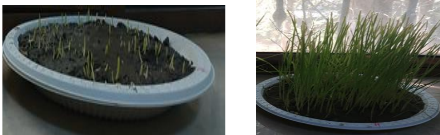
Рис. 2. Результаты опытов на необработанном в электрическом импульсном разряде лугово-серозёмном типе почвы, пшенице сорта Безостая-1 и измельченной шелухе Tamarix, полученные до и на 25 -й день эксперимента