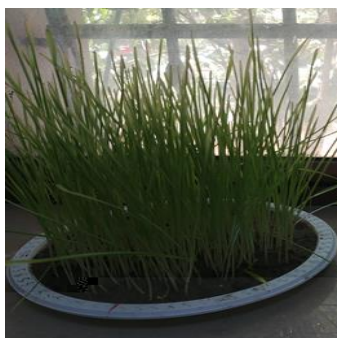
Рис. 1. Результаты опытов на необработанном в электрическом импульсном разряде лугово-серозёмном типе почвы и пшенице сорта Безостой-1, полученные до и на 25-й день эксперимента

Эксперимент № 2 – в опыте использовали необработанные в электрическом импульсном разряде: лугово-сероземную почву(450 г), пшеницу сорта Безостая-1 (20 г) и измельченную шелуху Tamarix 2 г (фото 2, табл. 1).