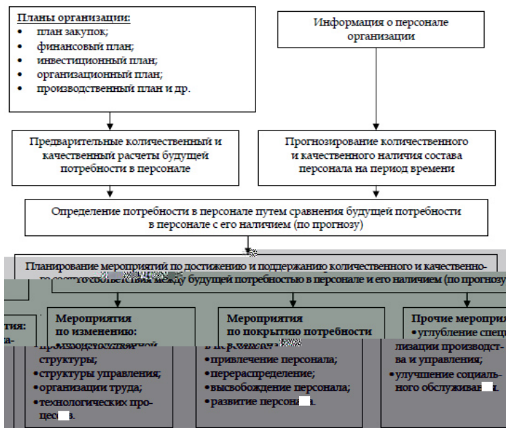
Рис. 2.2. Схема планирования потребности в персонале

Планирование потребности в персонале. Начальной ступенью процесса кадрового планирования является планирование потребности в персонале. Оно базируется на данных об имеющихся и запланированных рабочих местах, плане проведения организационно-технических мероприятий, штатном расписании и плане замещения вакантных должностей (рис. 2.2).