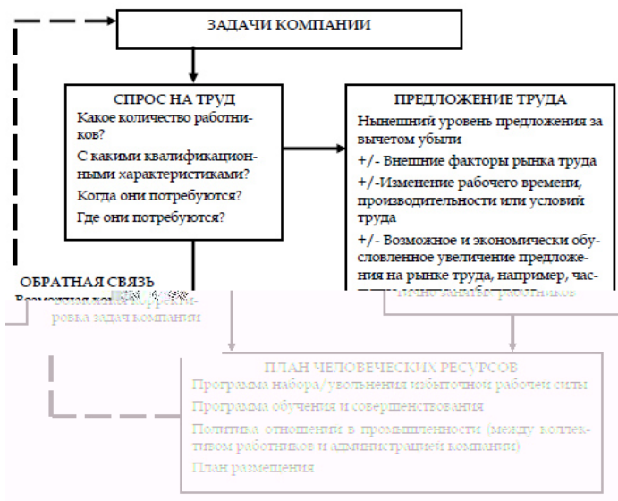
Рис. 2.1. Процесс планирования человеческих ресурсов

Этапами процесса планирования целей являются: поиск целей, анализ целей и их ранжирование, оценка возможностей реализации, выбор и реализация целей, контроль и их ревизия (рис. 2.1).