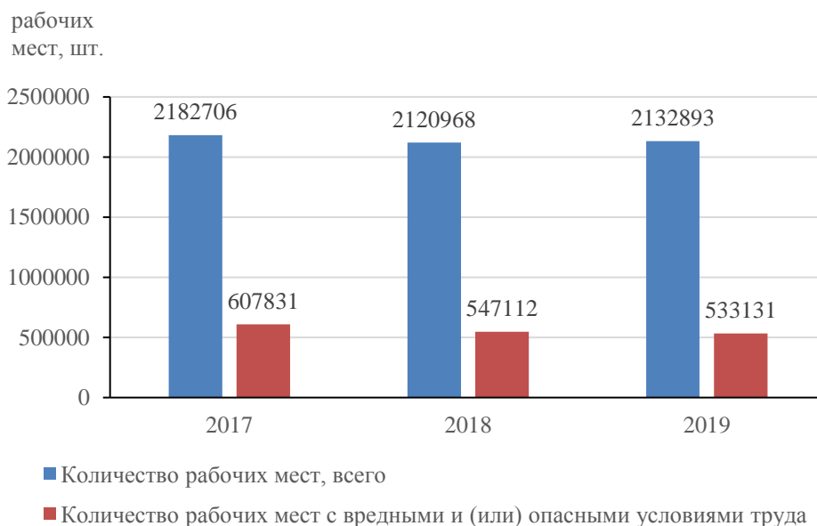
Рис. 1. Количество рабочих мест с вредными и (или) опасными условиями труда

Анализ данных Министерства труда и социальной защиты Республики Беларусь показывает, что общее количество рабочих мест в стране уменьшилось с 2182706 в 2017 г. до 2132893 в 2019 г. При этом количество рабочих мест с вредными и (или) опасными условиями труда уменьшилось с 607831 в 2017 г. до 533131 в 2019 г. (рис. 1).