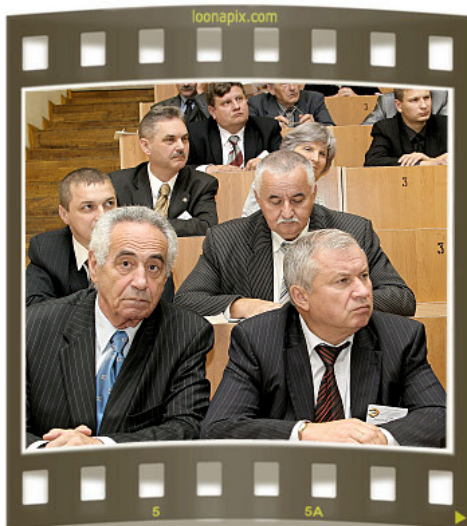
Среди парламентариев и производителей