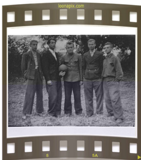
Такими они были – послевоенные школьники