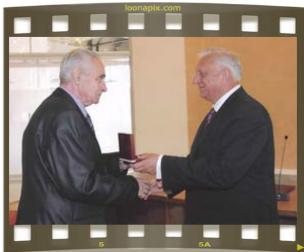
Премьер-министр Республики Беларусь Михаил Владимирович Мясникович вручает Медаль Франциска Скорины (2012)