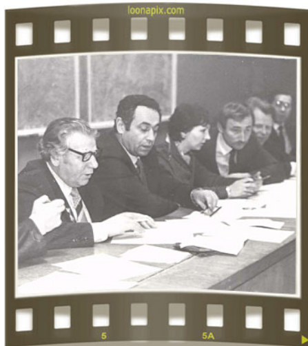
Студенческий конкурс по управлению сельхозпроизводством