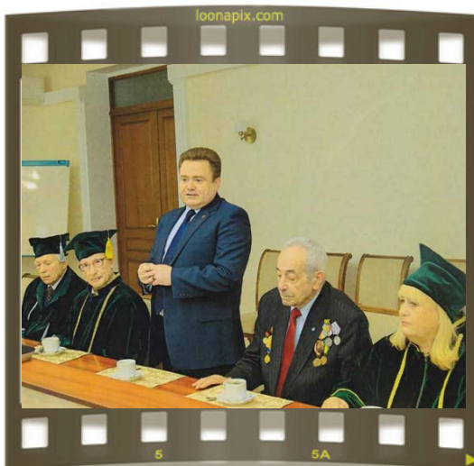
Профессорское собрание, посвященное Дню работников сельского хозяйства и перерабатывающей промышленности агропромышленного комплекса в БГСХА (ноябрь, 2021 г.)