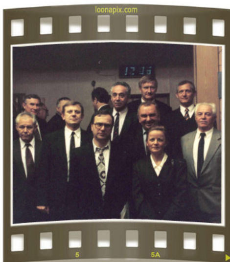
На международной научной конференции в Минске