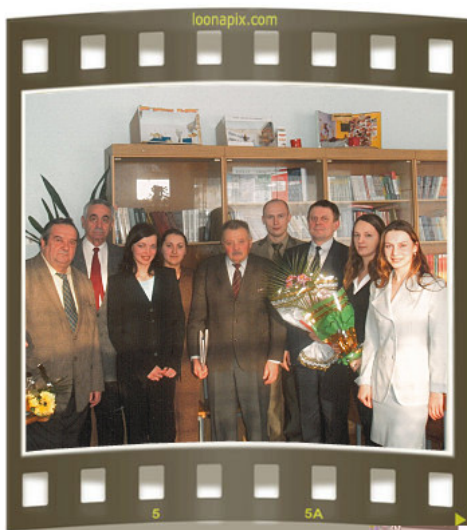
Первый выпуск магистрантов