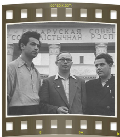
На Всесоюзной сельскохозяйственной выставке в Москве