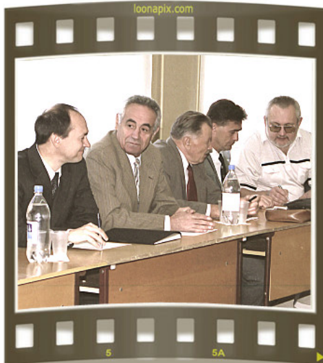
Заседание Государственной экзаменационной комиссии