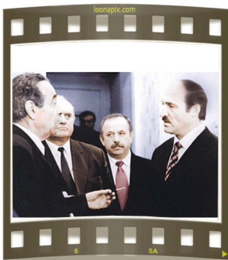
Посещение кафедры агробизнеса Президентом Республики Беларусь А. Г. Лукашенко