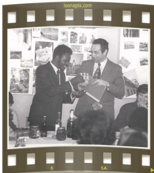
Встреча со студентами