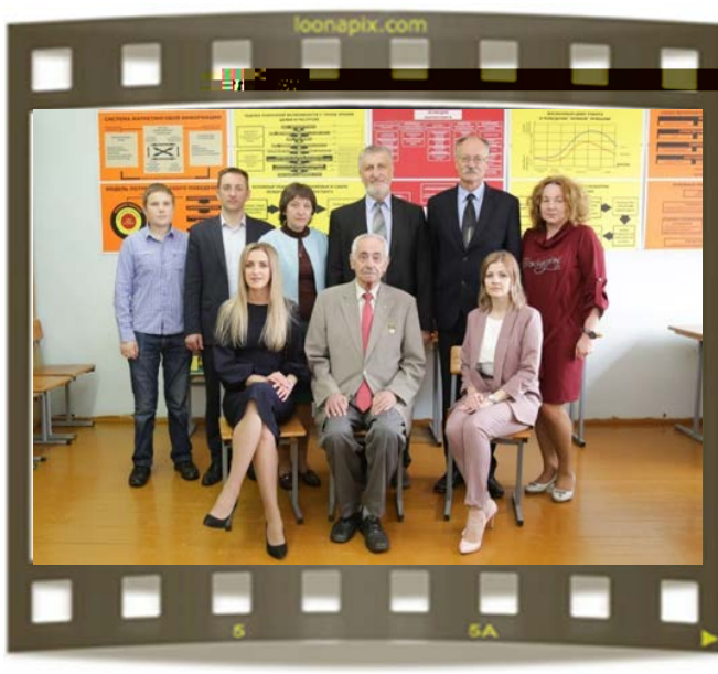
Сотрудники кафедры маркетинга