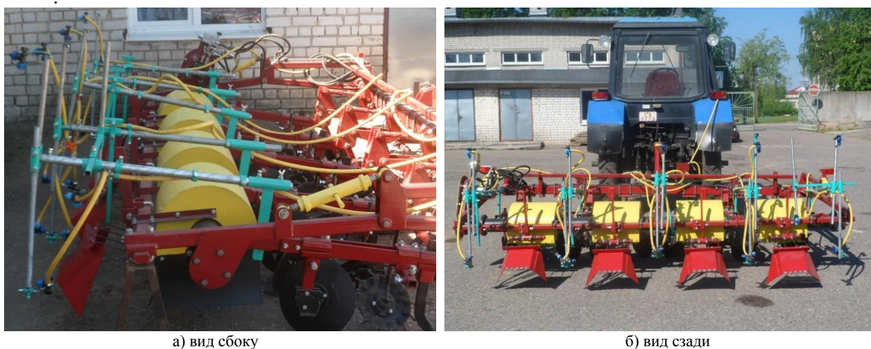
Рис. 2 Опрыскиватель телескопический комбинированный в составе агрегата для междурядной обработки АУ-М2

При обработке растений рабочими растворами ленточным способом на многовекторных узлах распыла 7 устанавливаются заглушки. Вертикальные стойки 6 с многовекторными узлами распыла 7, при этом поднимаются и фиксируются максимально вверх, а вертикальные стойки 11 с узлами распыла 12, направленными сверху вниз и расположенными на горизонтальных штоках 9 могут перемещаться вверх или вниз и фиксироваться в нужном положении, в зависимости от высоты ленточного внесения рабочих растворов. Ленточное внесение рабочих растворов может осуществляться перед посадкой картофеля при нарезке гребней, при довсходовой обработке или на верхнюю часть растений при послевсходовой обработке картофеля [16, 17, 18].