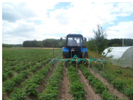
б) опрыскиватель в работе