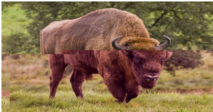
Рис. 2.12. Зубр

Все сегодняшние зубры происходят всего от двенадцати особей, находившихся в начале XX в. в зоопарках и заповедниках. Благодаря усилиям по его сохранению со стороны зоопарков и частных лиц в 1952 г. стало возможным вновь поселить первые свободные стада зубров в Беловежской пуще. В 2013 г. в мире насчитывалось 5 249 особей, из которых 1 623 животных проживало в неволе, а 3 626 – в полусвободном и свободном состоянии.