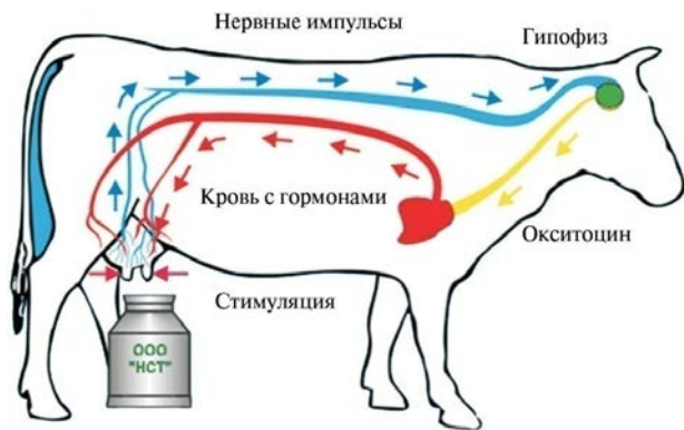
Рис. 4.1. Схема процесса молокоотдачи

Различают две фазы молокоотдачи. Первая фаза – сугубо нервная. Она наступает через 2–6 с после начала сосания, и теленок получает молоко. Вторая фаза – нейрогуморальная, наступает через 25–60 с от начала раздражения рецепторов, расположенных в коже, паренхиме вымени, сосках, особенно в зоне основания сосков. Вытирание, массаж вымени и сдавливание первых струек раздражают рецепторы. Импульсы, возникшие при сосании или доении в рецепторах, по афферентным нервным путям передаются в центральную нервную систему, из которой раздражения по эфферентным нервным путям распространяются на молочную железу, и происходит секреция молока. В рефлекторную дугу включается гормон задней доли гипофиза – окситоцин, который действует на миоэпителий, вызывает сокращение альвеол и мелких молочных протоков. Окситоцин действует в организме в течение 4–6 мин (рис. 4.1), после чего рефлекс молокоотдачи прекращается. Поэтому коров следует доить быстро, чтобы уложиться во время до разрушения окситоцина.