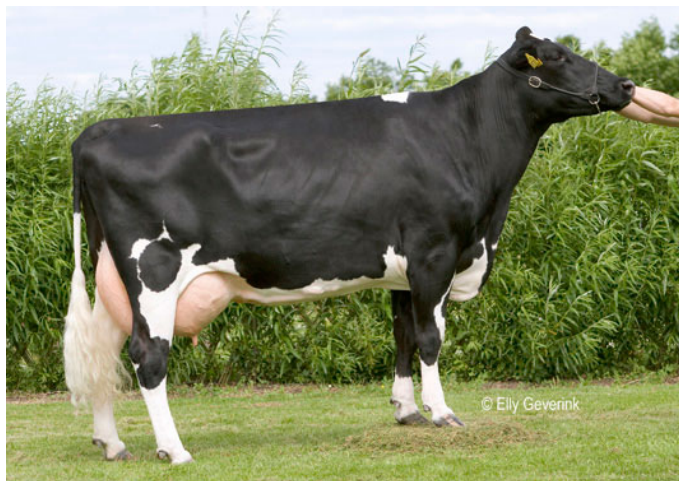
Рис. 6.1. Корова голландской породы

производству молока. Рекордисткой голландской породы является корова Кори 174, от которой в возрасте 11,5 лет за 305 дней лактации надоили 16 400 кг молока с содержанием 4,44 % жира и 3,82 % белка.