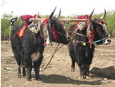
Рис. 2.8. Домашние яки