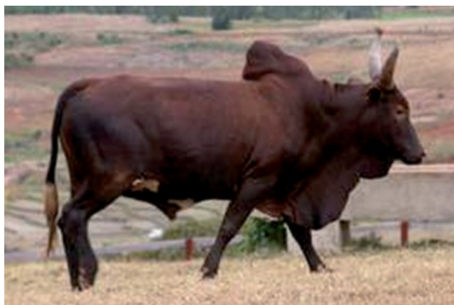
Рис. 2.13. Зебу

Зебу, или горбатый скот. Всего в мире насчитывается более 430 млн. голов зебу, более половины из них разводят в Индии, Пакистане и Бразилии (рис. 2.13). Наиболее ценные породы зебу сосредоточены на Кубе, в США и странах Латинской Америки. В СНГ распространена азербайджанская и среднеазиатская разновидность зебу. Животные хорошо чувствуют себя в условиях жаркого климата, устойчивы к высоким температурам, влажности, к ряду заболеваний, в том числе к пироплазмозу, и живут там, где другой скот гибнет. Зебу и зебувидный скот редко болеет бруцеллезом, лейкозом, туберкулезом, тимпанией. У них почти не бывает заболеваний вымени, копыт, желудочно-кишечного тракта.