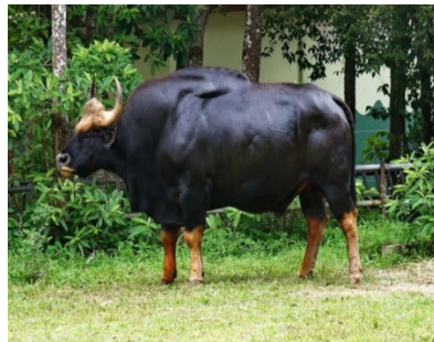
Рис. 2.6. Гаял

Длина тела гаура достигает более 3 м. Высота в плечах доходит до 2,3 м, а его масса может достигать 1 500 кг, в отдельных случаях – 2 000 кг. Взрослый самец весит около 1 300 кг. Шерсть бурая, с оттенками от красноватого до черного. Рога в среднем 90 см в длину и выгнуты вверх в форме полумесяца.