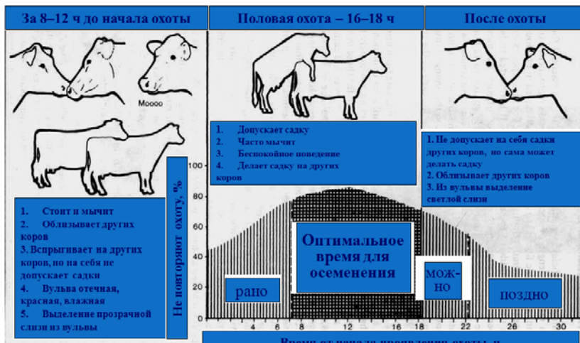
Рис. 8.1. Проявление половой охоты и оптимальное время для осеменения

Одним из наиболее точных методов определения оптимального времени осеменения коров является ректальная пальпация состояния фолликулов. Если они флюктуируют (жидкость в них перемещается), то через 6–10 ч произойдет овуляция.