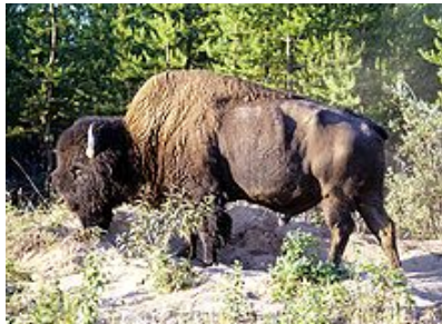
Рис. 2.11. Лесной бизон

Бизоны – полигамные животные. Доминантные самцы собирают небольшие гаремы. Гон проходит в июле – сентябре. Беременность длится около 9 мес. Самка обычно рождает одного теленка, двойни крайне редки. Жирность молока до 12 %.