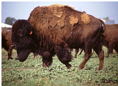
Рис. 2.10. Степной бизон