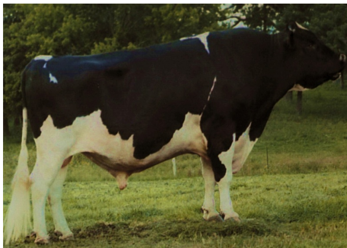
Рис. 6.3. Бык-производитель голштинской породы