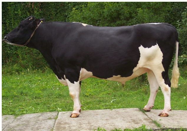
Рис. 6.5. Бык-производитель белорусской черно-пестрой породы