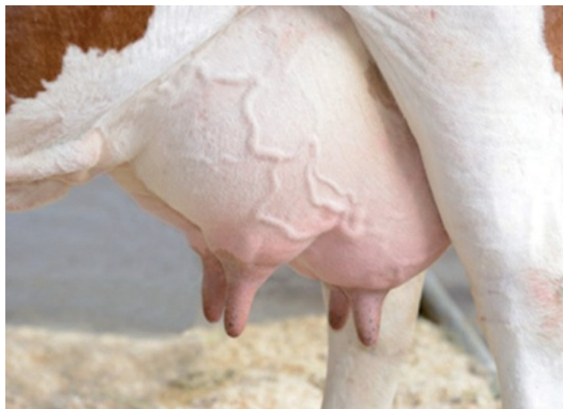
Рис. 3.2. Вымя коровы

Одной из важнейших функциональных систем молочной коровы является вымя (рис. 3.2).