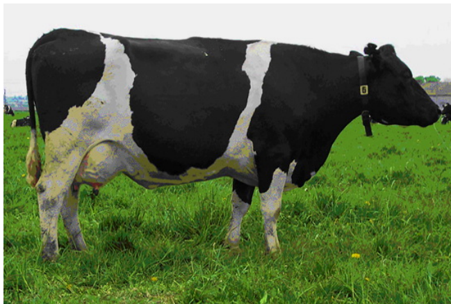
Рис. 6.4. Корова белорусской черно-пестрой породы

грудью с небольшим подгрудком, ровной спиной и поясницей, широким крестцом и задом; конечности правильно поставленные; кожа средней толщины, эластичная; мускулатура развита удовлетворительно; вымя объемистое, чаще чашеобразной или округлой формы с равномерно развитыми долями, соски цилиндрической или слегка конической формы (рис. 6.4, 6.5).