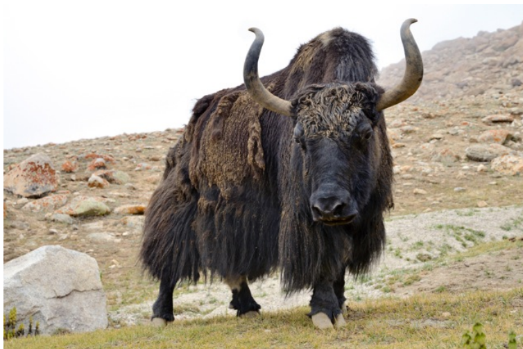
Рис. 2.7. Як

Як – парнокопытное млекопитающее из рода настоящих быков семейства Полорогие (рис. 2.7).