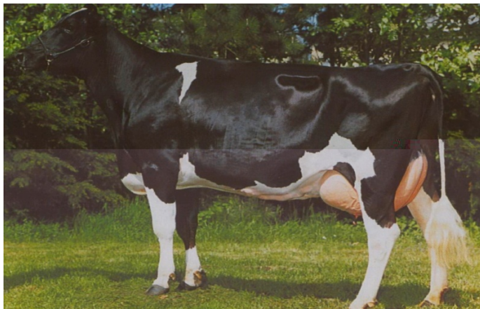
Рис. 6.2. Корова голштинской породы

телочки – 38–42 кг. Живая масса коров составляет 650–700 кг (до 800 кг), высота в холке – 142–145 см, быков-производителей – соответственно 1 100–1 200 кг (до 1 300 кг) и 160–165 см. Грудь у коров глубокая (до 86 см), достаточно широкая (до 65 см); задняя часть туловища длинная, прямая и широкая (ширина зада в маклоках – 63 см).