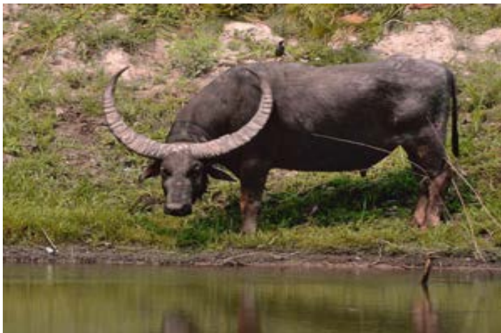
Рис. 2.3. Азиатский (индийский) буйвол

В большинстве мест буйволы живут сейчас на строго охраняемых территориях, где они привыкли к человеку и уже не являются дикими в строгом смысле этого слова. Индийский буйвол также завезен в XIX в. в Австралию и широко расселился на севере континента.