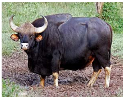
Рис. 2.5. Гаур

Гаур – крупнейший представитель рода настоящих быков (рис. 2.5). Одомашнен человеком. Одомашненная форма называется гаял или митхун (рис. 2.6).