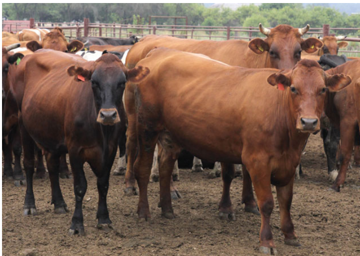
Рис. 6.8. Красный белорусский скот