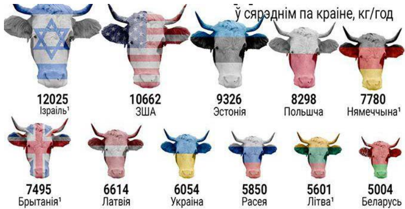
Рис. 1.2. Удой на 1 корову в среднем по стране, кг/год

В США удой на 1 корову превышает 10 000 кг, в европейских странах – 7 000 кг в год.