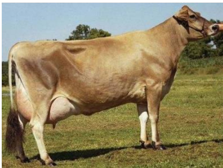
Рис. 6.6. Корова джерсейской породы

Масть джерсеев рыжая, светло-бурая. Быки имеют более темную окраску головы, шеи, передней части туловища и, как правило, черную полосу вдоль спины. У некоторых животных на конечностях и нижней части туловища бывают белые отметины. Носовое зеркало, кончики рогов и копыта темные. Волосы вокруг носового зеркала и на внутренней стороне ушных раковин светлые (рис. 6.6).