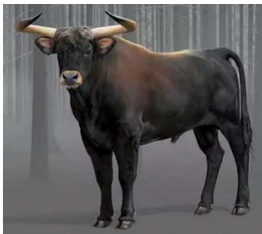
Рис. 2.1. Тур – предок крупного рогатого скота

Тур. Разновидности тура различались между собой по ряду признаков. Но для всех их был характерен высокий рост, мощное развитие туловища, высокие и крепкие конечности (рис. 2.1). Масть туров была черная, темно-бурая с белой или желтой полосой вдоль спины. Они обладали большой силой, ловкостью и злобным характером. Высота в холке у коров составляла 150–170 см, у быков – 175–200 см. Масса быков была более 800 кг и достигала 1 500 кг.