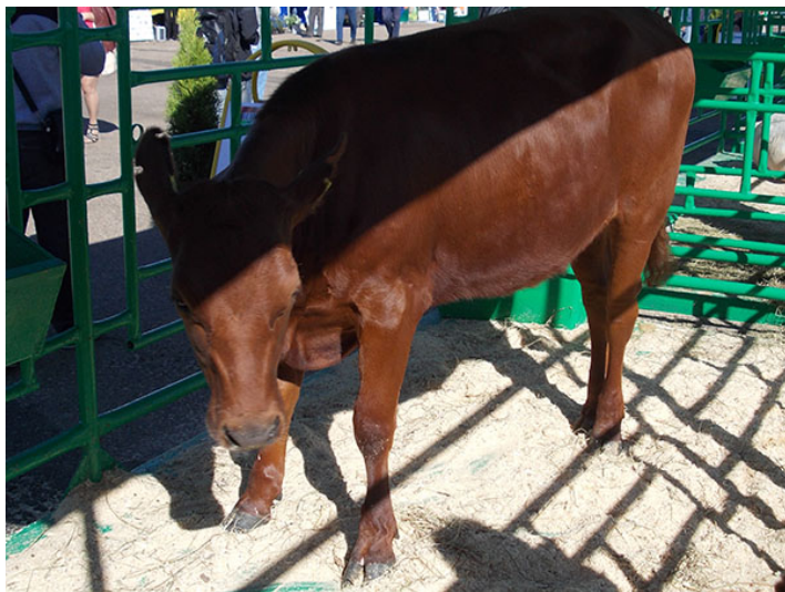
Рис. 6.7. Телочка красной белорусской породной группы на выставке «Белагро-2019»