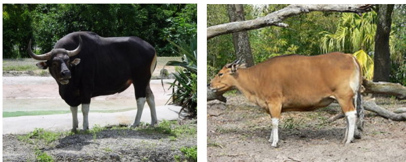
Рис. 2.4. Бантенг

Бантенги своим внешним видом отдаленно напоминают коров (рис. 2.4). У самцов, в зависимости от подвида, черно-коричневая либо желтовато-коричневая шерсть, в то время как у самок она, как правило, красно-коричневого цвета. У обоих полов нижняя и задняя сторона белые. Бантенги весят от 400 до 900 кг, имеют длину тела до 2,25 м и высоту в холке до 190 см. У самцов толстые изогнутые рога, достигающие 70 см. Рога самок существенно короче – лишь 30 см.