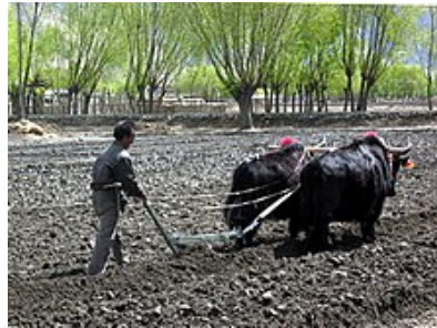
Рис. 2.9. Як на вспашке поля (Тибет)

Они разводятся на юге Сибири и в Монголии, отличаются меньшей выносливостью, но также и меньшими размерами и более смирным нравом. В Бутане яков скрещивают с гаялами.