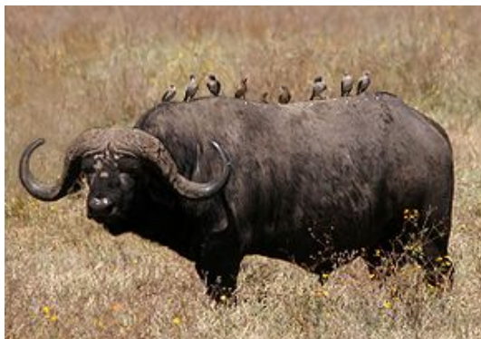
Рис. 2.2. Африканский буйвол

Африканский буйвол , или черный буйвол , кафрский буйвол , – вид быков, широко распространенный в Африке (рис. 2.2). Это один из крупнейших современных быков. Масса взрослых самцов крупных подвидов иногда достигает 900–1 000 кг. Изредка встречаются старые быки массой до 1 200 кг. Высота в холке у взрослых самцов – до 1,8 м при длине тела 3–3,4 м. Рога африканского буйвола образуют мощный щит на лбу.