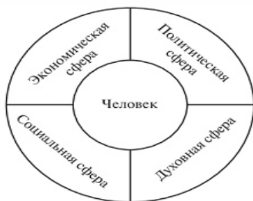
Рис. 3.1. Сферы жизни общества

Графически сферы жизни общества представлены на рис. 3.1.