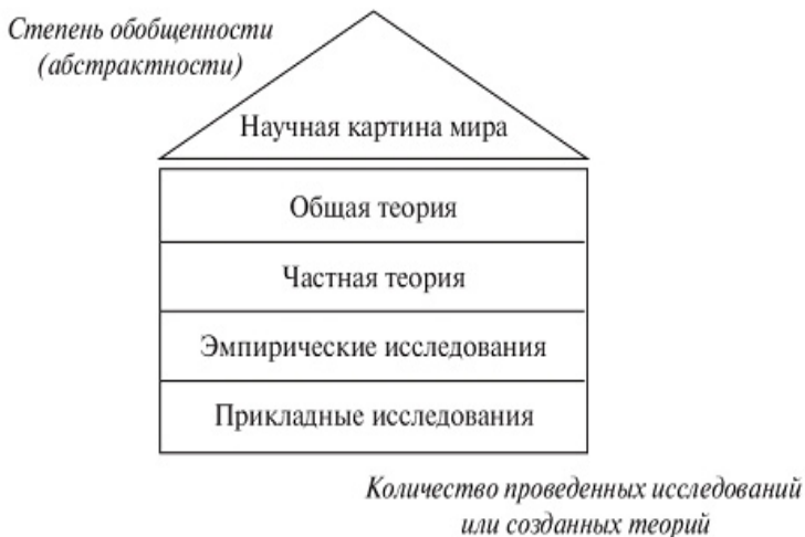
Рис. 1.1. Пирамида уровней и типов научного социологического знания

Четыре верхних этажа социологического «здания» занимает фундаментальная социология, а последний – прикладная социология. Три верхних этажа – теоретическая социология. Два нижних – эмпирические и прикладные исследования – принято относить к эмпирическим знаниям.