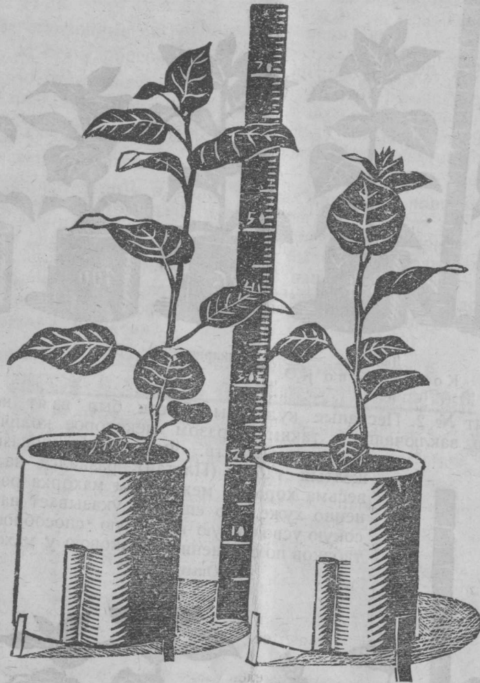
С табачною пылью