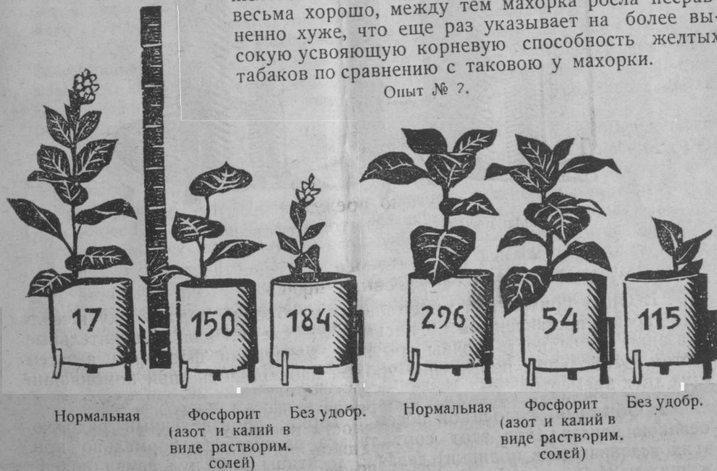
Нормальная Фосфорит (азот и калий в виде растворим. солей) Без удоб. Нормальная Фосфорит (азот и калий в виде растворим. солей) Без удоб.