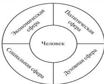
Рис. 2.1. Сферы жизни общества

Графически сферы жизни общества представлены на рис. 2.1.