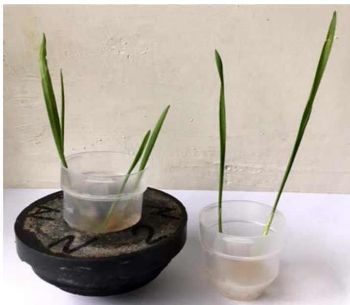
Рис. 3. Проявление угнетающего влияния магнитного поля при длительном (10 дней) воздействии на семена яровой пшеницы Омега (апрель–май 2021 г.)

Проявление угнетающего действия прослеживалось и на последующем развитии зерен яровой пшеницы при ее проращивании в стаканчиках, находящихся в исследуемом блоке магнитов под действием постоянной магнитной индукции в 12,15 мТл (рис. 3).