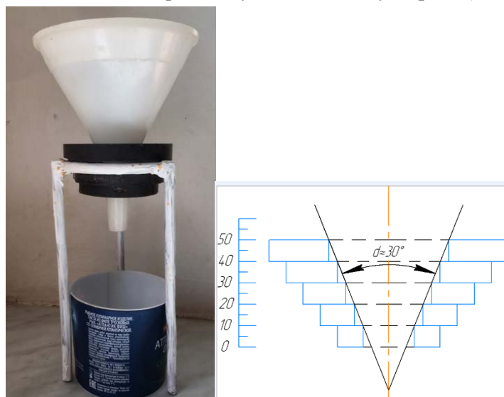
Рис. 1. Лабораторная установка для проведения экспериментов с магнитной обработкой зерна и схема расположения магнитов

В основу методики проведения экспериментальных исследований была положена реализация задачи максимального использования индукции магнитного поля применяемых магнитных устройств. Одним из вариантов достижения поставленной цели является устройство с последовательным расположением кольцевых магнитов в виде обратного усеченного конуса (рис. 1).