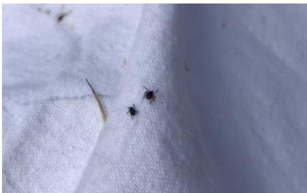
Рис. 1. (собственные данные) – «Улов» из клещей на волокуше»

Кусок материи 60x100 см прикрепляли узкой стороной к палке. Протаскивали развернутый флаг по растительности перед собой или сбоку, периодически проводя осмотр флага (рис. 1). При этом флаг скользил по траве большей частью своей поверхностью.