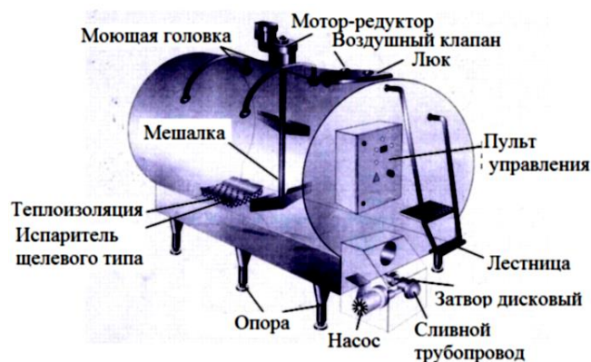
Рис. 2. Составные элементы резервуара-охладителя молока Г6-ОРМ-2500

Установка охлаждения молока УНОМ-1200 (рис. 3) открытого типа, работающая по принципам непосредственного и промежуточного охлаждения. Установка является стационарной и предназначена для сбора, интенсивного охлаждения и хранения молока при пониженной температуре на молочных фермах и молокоперерабатывающих предприятиях при температуре окружающего воздуха от +5 до +40 °С. Установка представляет собой емкость с двустенной оболочкой, межстенное пространство которой заполнено высокоплотным пенополиуретаном.