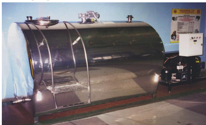
Рис. 3. Установка охлаждения молока УНОМ-1200

Установки непосредственного охлаждения как открытого, так и закрытого типов, допускают смешивание молока различных партий, т. е. в резервуар, уже частично заполненный охлажденным молоком, может подаваться парное молоко, получаемое во время второй дойки. Критерием, ограничивающим смешивание молока различных партий, является продолжительность охлаждения до +4 °С молока при второй дойке, которая не должна превышать 1 часа. Грамотный подбор вместимости охладителя молока и холодопроизводительности его компрессорной установки позволяет заполнять молочный танк до полной загрузки и соответственно снижать затраты на транспортировку молока до молокоперерабатывающих предприятий [5].