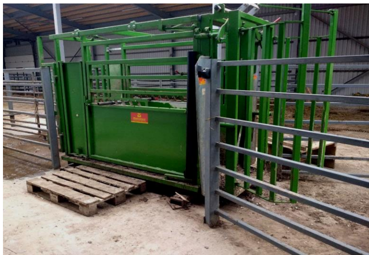
Р и с 1 Электронные весы для взвешивания животных

индивидуальное взвешивание молодняка при рождении в возрасте 1 мес, 2 мес., 3 мес., и 6 мес с помощью электронных весов (рис 1)