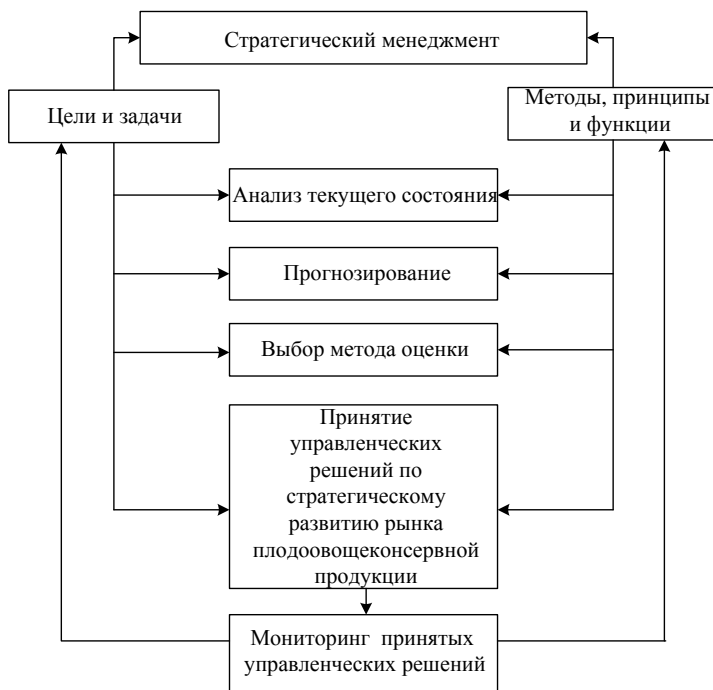
Рис. 2. Блок-схема разработки стратегии инновационного развития рынка плодоовощеконсервной продукции

Блок-схема разработки стратегии устойчивого инновационного развития рынка плодоовощеконсервной продукции включает следующие этапы: формирование целей и задач управления, анализ текущего состояния, прогнозирование, выбор метода оценки, принятие управленческих решений по стратегическому развитию, анализ и контроль выполнения принятых управленческих решений (рис. 2).