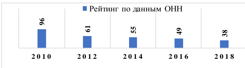
Рис. 1. Рейтинг готовности к электронному правительству (место Беларуси среди 193 стран мира)

На основе целей и задач электронное правительство предусматривает модели взаимодействия: между различными уровнями (центральный, региональный, местный) и типами (исполнительная, законодательная, судебная и др.) государственной власти (G2G, Government-to-Government); государством и государственными чиновниками (G2E, Government-to-Employees); государством и бизнесом (G2B, Government-to-Business; B2G, Business-to-Government); государством и гражданами (G2C, Government-to-Citizen; C2G, Citizen-to-Government).