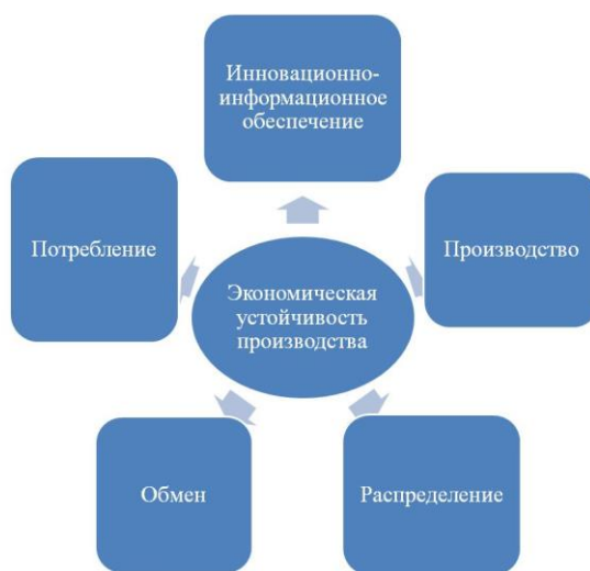
Рис. 1. Стадии процесса воспроизводства Примечание. Собственная разработка автора.

На наш взгляд, предшествовать производственной стадии должна не просто стадия научного обеспечения как такового. Эта стадия должна включать в себя информирование сельскохозяйственных организаций по комплексу направлений: о последних инновационных разработках в сфере сельскохозяйственного производства, о наличии и стоимости кредитных ресурсов, об изменениях в законодательной базе, рынках и условиях сбыта продукции в стране и за рубежом, о наличии и стоимости материальных и трудовых ресурсов, о долговременных агроклиматических прогнозах и о других вопросах, оказывающих влияние на любую из последующих стадий воспроизводственного цикла. И каждая из этих стадий будет оказывать непосредственное влияние на общую экономическую устойчивость производства в сельскохозяйственной организации, и, в свою очередь, успешность реализации каждой стадии будет зависеть от уровня устойчивости (рис. 1).