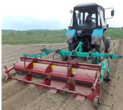
а) вид сбоку

В этой связи интерес представляет культиватор со щеточными барабанами, копирующими поверхность гребней, сформированных перед или при посадке культурных растений. Однако с целью обоснования конструктивно-режимных параметров рабочих органов необходимо провести дополнительные исследования. Культиватор состоит (рис. 1) из рамы с устройством для навески 1, рыхлительных и окучивающих лап на чизельных стойках 2, щеточных барабанов 3 и гребнеобразователя 3 с копирующими колесами 5.