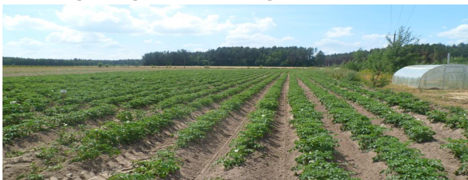
Рис. 3. Обработка посадок картофеля усовершенствованным агрегатом

Агрегат с усовершенствованными и разработанными рабочими органами для уничтожения сорной растительности проходил испытание также на опытном поле УО ГГАУ и в фермерском хозяйстве «Горизонт» Мостовского района Гродненской области (рис. 3).