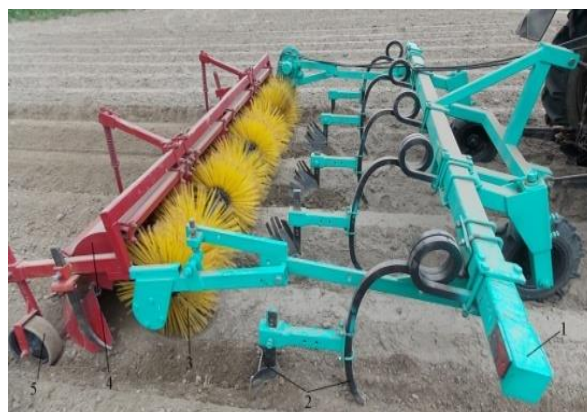
б) задне-боковой вид