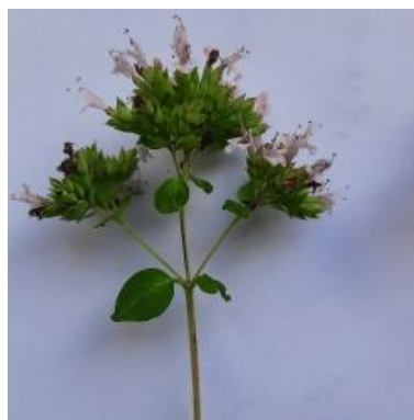
соцветие плотное со средней длины кистью