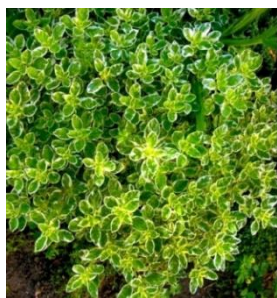
зеленая с белой окантовкой