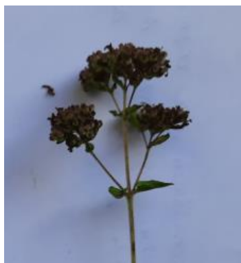
соцветие плотное с короткой кистью