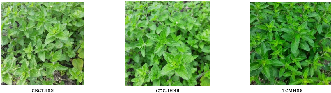
Рис. 3. Интенсивность зеленой окраски душицы обыкновенной

1) растение: интенсивность зеленой окраски (светлая, средняя, темная) – учет проводится до цветения (рис. 3);