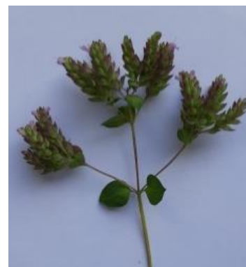
соцветие рыхлое с длинной кистью