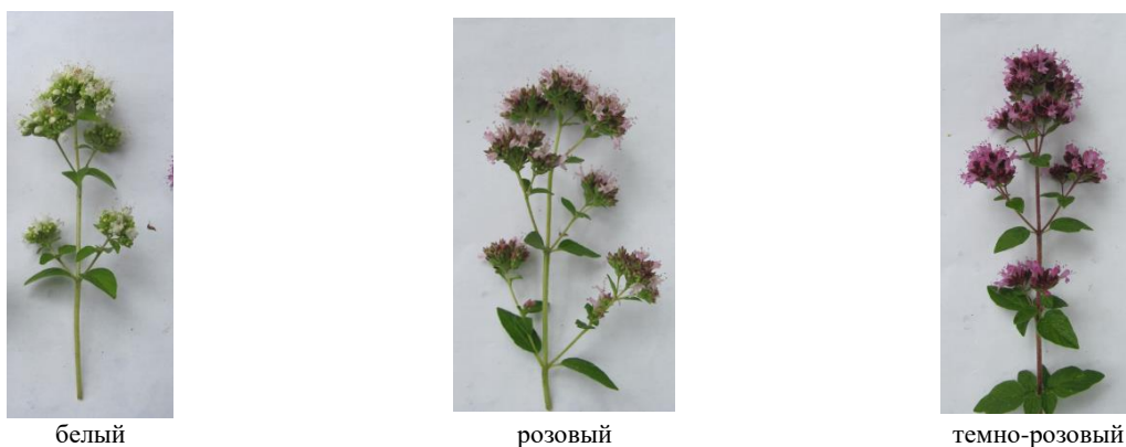
Рис. 2. Окраска венчика душицы обыкновенной

4) время начала цветения (раннее – менее 65 дней, среднее – 65–80 дней, позднее – более 80 дней). Определяют по числу дней с момента начала весеннего отрастания до распускания цветков. Началом цветения считают фазу, когда 10 % растений имеют открытые цветки.