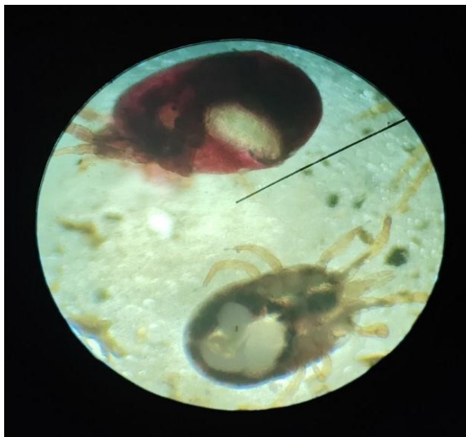
Рис. 1. Имаго Dermanyssus gallinae (вверху) и Ornithonyssus sylviarum (внизу), x10

Выявленные паразиты представлены на рисунках.