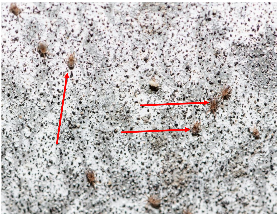
Рис. 3. Ornithonyssus sylviarum на поверхности металлических конструкций батареи птичника

Напротив, батареи по содержанию кур-несушек были заселены Dermanyssus gallinae и Ornithonyssus sylviarum , при этом часто возбудители регистрировались в смешанной инвазии со 100 % поражением кур дерманиссиозом и 36,1 % инвазированием орнитониссусами (рис. 3).