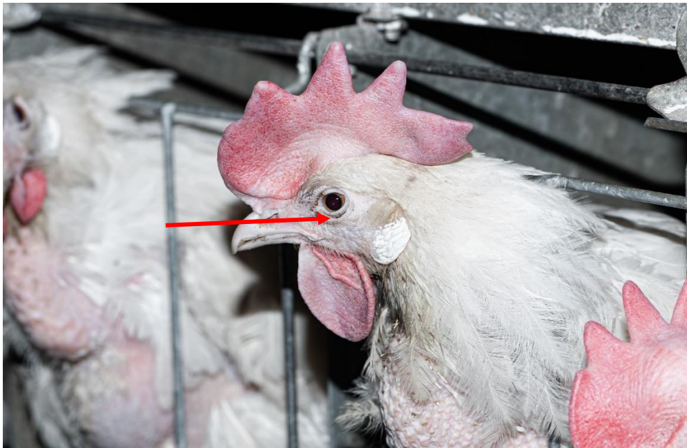
Рис. 2. Dermanyssus gallinae : место локализации – вокруг глаза несушки (красная стрелка)

Необходимо отметить, что присутствие дерманиссусов на теле птицы нами было установлено днём, что, согласно литературным данным, считается нехарактерным для данного вида [1, 4, 5]. При этом выявлена зависимость экстенсивности инвазии от возраста птицы, чем старше была птица, тем чаще у неё регистрировался дерманиссиоз.