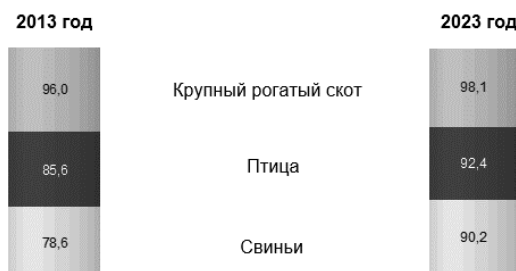
Рис. 1. Поголовье скота и птицы в сельскохозяйственных организациях за последние 10 лет [5]

Примечание. Составлено автором по данным источника [5].