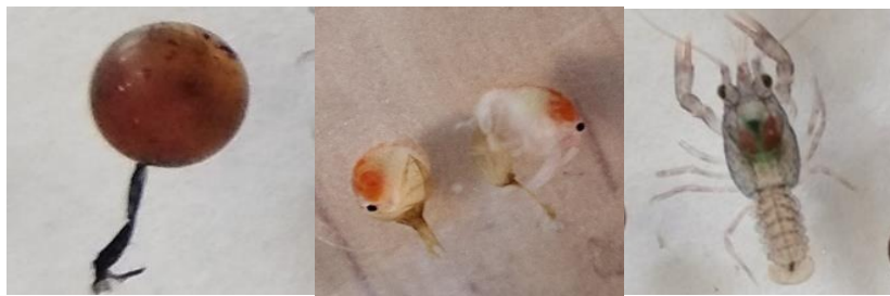
I – икринка с гиалиновой нитью; II – выклев личинки и личинка I стадии; III – личинка II стадии

Инкубация в аппаратах Вейса проходила 2 стадии развития раков, от икринки на стадии глазка до личинок I стадии и пройдя этап первой линьки до личинок II стадии. После выклева из икры рачки I стадии (рис. 3) средним размером – 12 мм, весом – 24 мг мало двигались, и практически неподвижно находились на сетчатых площадках (рис. 4).