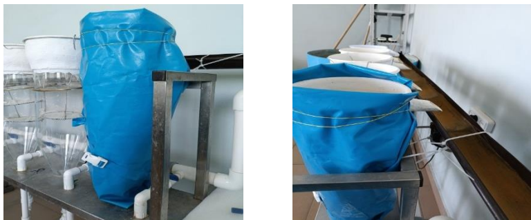
Рис 2. Затемнение аппарата Вейса

В четвертый аппарат так же была помещена одна сетчатая площадка с размещенными на ней 702 шт. икринок, при этом аппарат обматывался непрозрачным материалом из ПВХ (рис. 2).