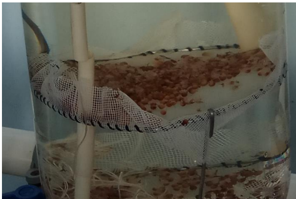
Рис. 4. Инкубация личинок I стадии узкопалого рака в аппаратах Вейса на сетчатых площадках

Проанализировав результаты по инкубации икры узкопалого рака на сетчатых площадках, с разным материалом, местом расположения и количеством икры, а также с использованием затемнения аппаратов, были получены следующие результаты.