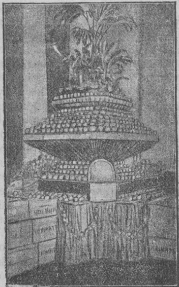
Культура фруктовъ въ Подольской губ.