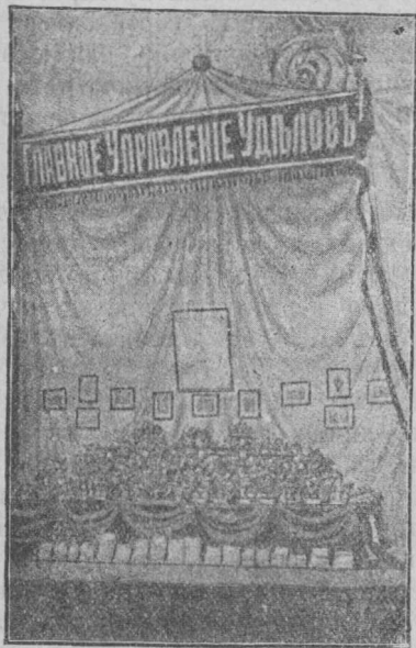
Павильонъ Главнаго Управленія Удѣловъ.

между крымцами, получившій садъ почти заброшеннымъ и въ четыре года сдѣлавшій такіе успѣхи въ культурѣ, которые показываютъ въ немъ недюжиннаго плодовода. Однако, крымцы мнѣ говорили, что фрукты г. Таурскаго не составляютъ какаго либо рѣдкаго исключенія въ Крыму: еслибы захотѣли другіе крымскіе экспоненты выставить побольше своего товара, и еслибы этому не мѣшала недостаточность мѣста