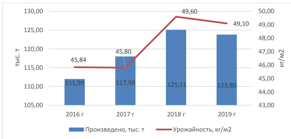
Рис. 1. Производство и урожайность тепличных овощей в Республике Беларусь

Тепличное овощеводство республики как отрасль характеризуется стабильностью производства и динамичным развитием (рис.1). На 1 января 2020 года общая площадь теплиц в наиболее крупных тепличных комбинатах республики составляет 252,2 га, в них выращивается более 95 % всей тепличной продукции.